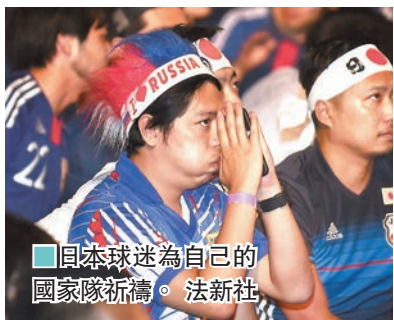
■日本球迷為自己的國家隊祈禱。

H組最後一輪日本對波蘭比賽的尾段出現了詭異一幕，落後一球的日本在最後10分鐘放棄進攻保持控球，而確定出局的波蘭亦未有試圖逼搶任由時間流逝，最終日本在全場喝倒彩下得償所願，成為今屆世界盃新引入的公平競技規則的首個得益者，力壓塞內加爾躋身16強。消極作賽卻受惠於「公平」之名，日本隊的行為免不了惹來非議，甚至連日本球迷亦認為球隊有欠體育精神。