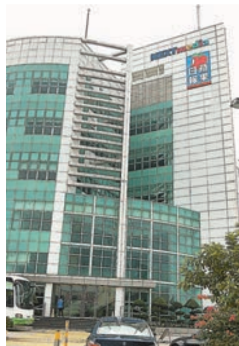
壹傳媒股價近期持續下瀉,昨日股份更遭恐慌性拋售,股價一度跌穿0.2元水平,收市報0.211元。