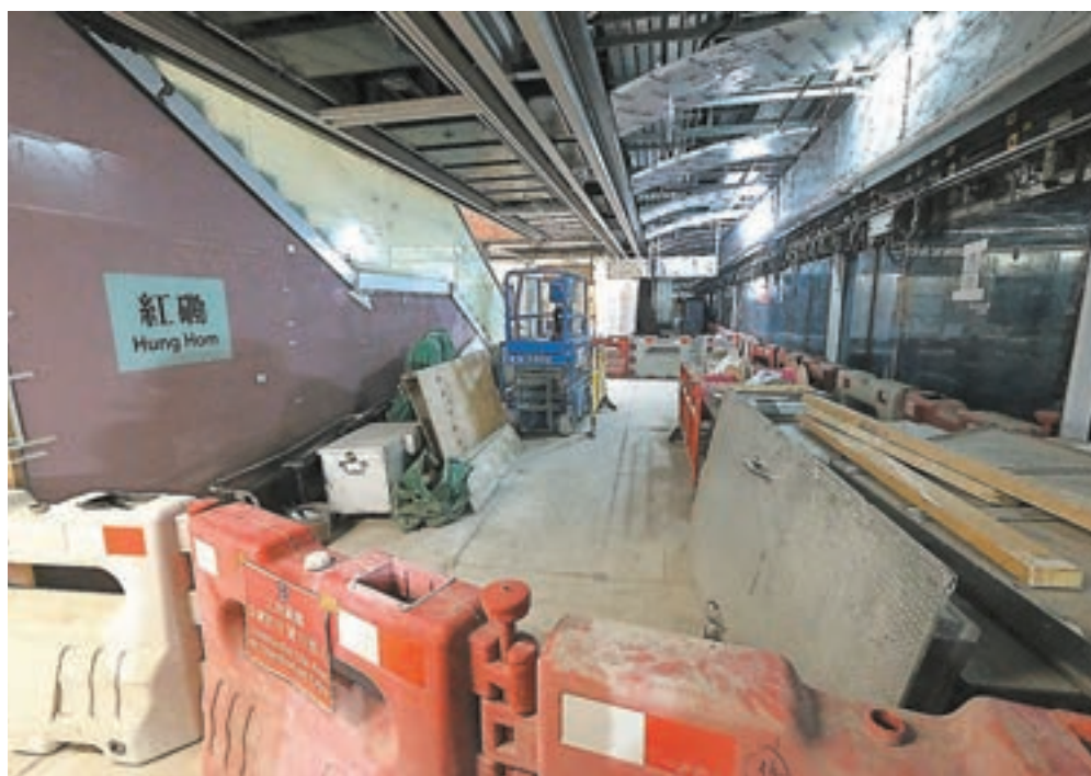
港鐵沙中線紅磡站地盤。