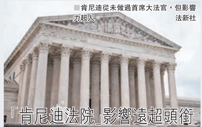
肯尼迪從未做過首席大法官，但影響力超人。