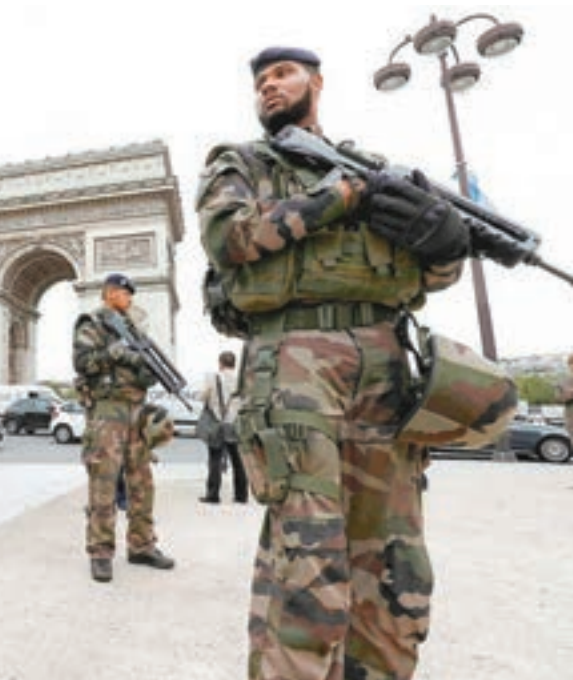
馬克龍希望藉此提升法國青年的公民責任及國家團結意識。

法國總統馬克龍於去年大選期間，提出恢復1997年廢止的強制兵役，希望藉此提升法國青年的公民責任及國家團結意識，但引起廣泛爭議。當局最終被迫調整計劃，於前日公佈兩階段的國民義務役方案，第一階段會強制年滿16歲的青年男女接受為期一個月的軍訓或義工服務，第二階段則讓25歲以下青年自願進行3個月至一年的國防領域服務。