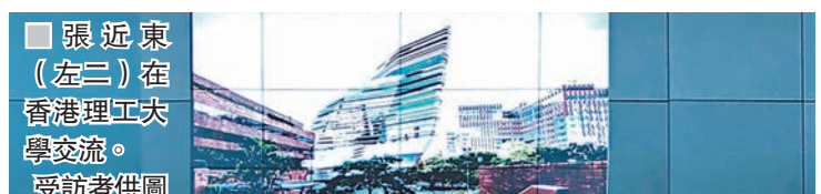
張近東（左二）在香港理工大學交流。

香港文匯報訊（記者 葛沖）全國工商聯副主席、蘇寧控股集團董事長張近東昨日到香港理工大學，與學生及創業人士分享做生意的心得。