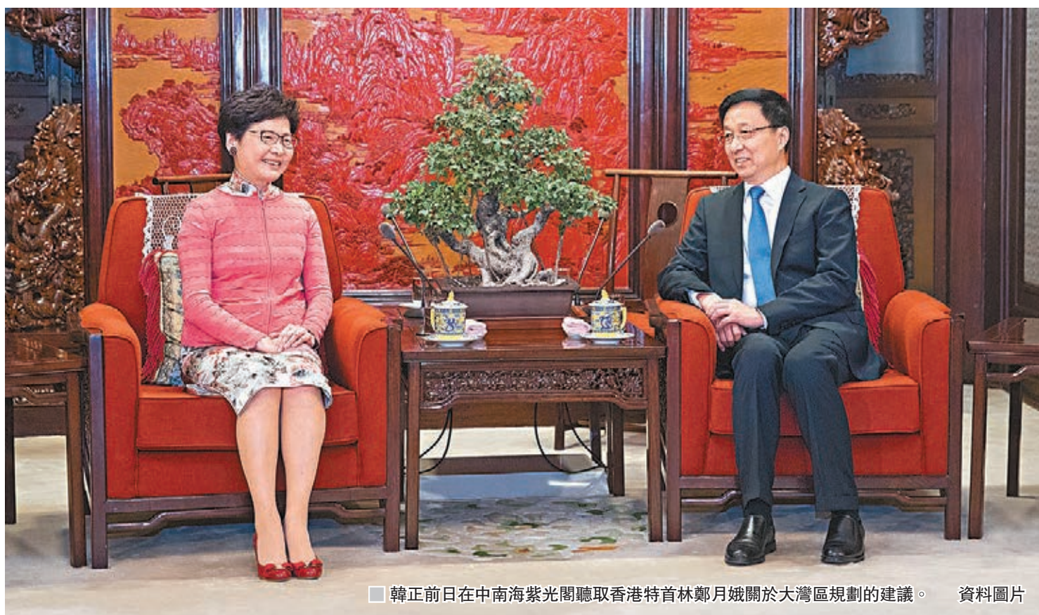
韓正前日在中南海紫光閣聽取香港特首林鄭月娥關於大灣區規劃的建議。 資料圖片

香港文匯報訊（記者 子京）粵港澳大灣區規劃將為港人，特別是年輕人開拓一片廣闊的發展新天地。香港各界青年昨日表示，國家主席習近平一直都非常關心香港青年發展，更親自謀劃、部署、推動大灣區規劃發展，既推動香港融入國家發展大局，同時更讓香港青年可以共享國家發展紅利，充分體現了習主席「以人民為中心」的治國思想。是次規劃由主管港澳事務的中共中央政治局常委、國務院副總理韓正統領落實，相信將出台一套完整有利香港全面穩定發展的規劃，包括推動香港建設科創中心等，絕對值得期待，港青必須珍惜機會。