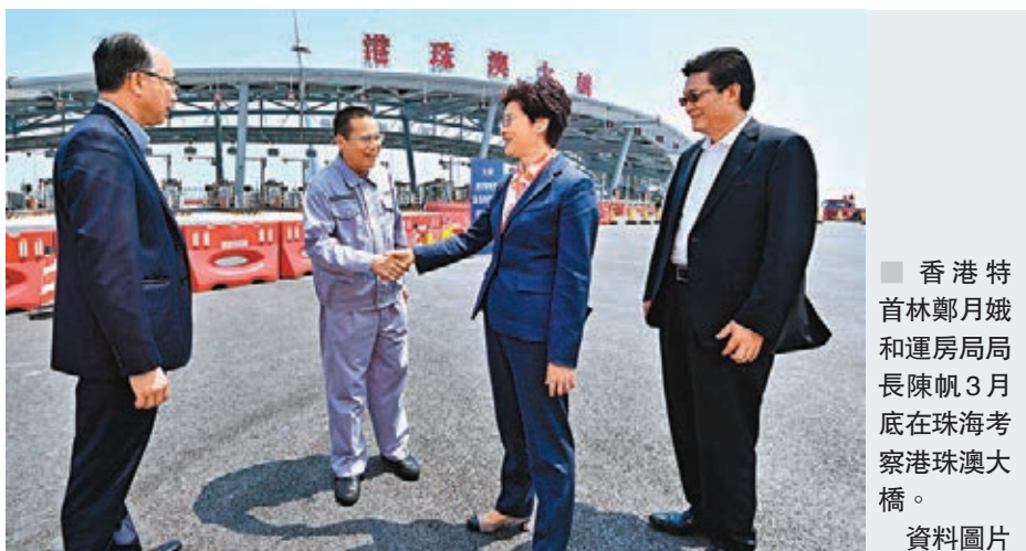
香港特首林鄭月娥和運房局局長陳帆3月底在珠海考察珠澳大橋。

全國政協委員、香港青年聯會副主席樓家強表示，大灣區規劃以粵港澳三地各自的獨特優勢建立互利的合作關係，為區內帶來了巨大的發展機遇。韓正副總理