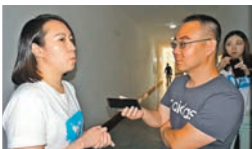
香港傳媒學子接受當地媒體採訪。

香港文匯報訊(記者 劉俊海 蘭州報道)本月26日，「范長江行動——2018香港傳媒學子甘肅行」啟動儀式在蘭州舉行，人民網甘肅頻道、中新社甘肅分社、甘肅日報、甘肅電視台、中國甘肅網、每日甘肅網、絲路明珠網等十多家媒體均派出記者對活動進行了及時的採訪和報道，並有眾多媒體轉載相關報道。