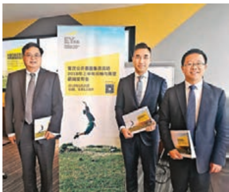
安永在上海發佈《安永中國內地和香港IPO市場調研報告》。

香港文匯報訊（記者章蕪蘭、實習記者丘曉陽）安永昨發佈的《安永中國內地和香港IPO市場調研報告》顯示，上半年A股料共有63家公司IPO資931億元人民幣，而同期香港98家公司IPO集資額為503億元港幣。該行預計，香港下半年集資額將達到1,500億元港幣，全年或逾2,000億元港幣。而A股由於新股審核仍將較為嚴格，發行節奏將繼續平緩。