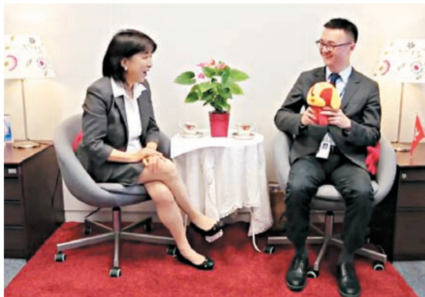
鄭守崗(右)接受Ann姐訪問，並以腹語打招呼。

與問責官員對話，Ann姐亦不放過反映民意的機會，指出現時街上鼠患問題嚴重，常見老鼠聯群結隊在街上肆意行走，還有公廁的衛生問題。 鄭守崗表示，政府樂意聆聽大家意見，若大家發現有什麼衛生問題，可隨時向局方反映，他們會認真處理，盡力提升香港的衛生水平。