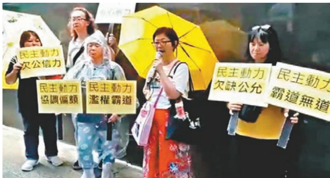
「鳩鳴團」成員直踩AV仁律師行，抗議「民主動力」協調偏頗、濫權霸道。 2019區議會300+ fb截圖