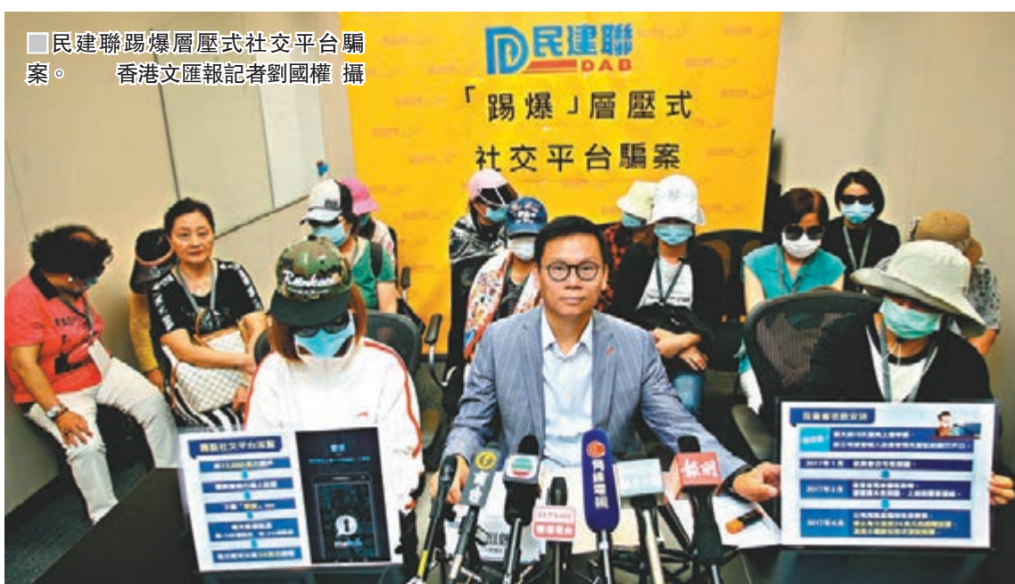
■ 民建聯踢爆層壓式社交平台騙案。

香港文匯報訊（記者 聶曉輝）又有市民懷疑在層壓式推銷手法中被騙去金錢，今次更是透過手機 App 應用程式蒙受損失。民建聯立法會議員陳恒鑌表示，上月收到市民求助指他們被游說下於去年加入「Metalk 密語」投資計劃，只需繳付 1.5 萬美元「入場費」再每天收發短訊便可賺取每日 54 美元回報且「多買多得」，惟去年 4 月卻突獲該公司告知不再經營，只能透過分階段獲取碎股的方式取回部分投資本金。陳恒鑌表示，暫時接獲 31 名苦主求助，單是其中 16 名苦主已合共損失逾千萬元本金，若連同承諾回報更多達 4,110 萬元，最終涉及金額肯定不止此數。其中 15 名苦主昨日已向警方報案。