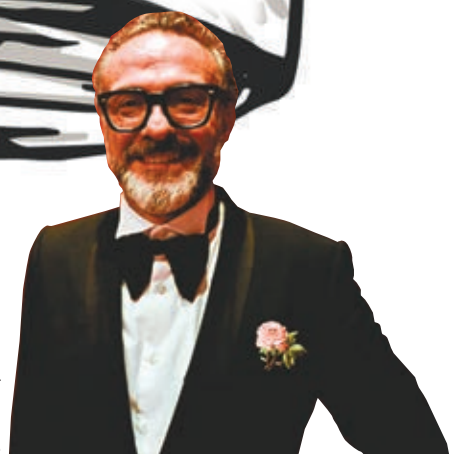
博圖拉為冠軍餐廳 Osteria Francescana 主廚。