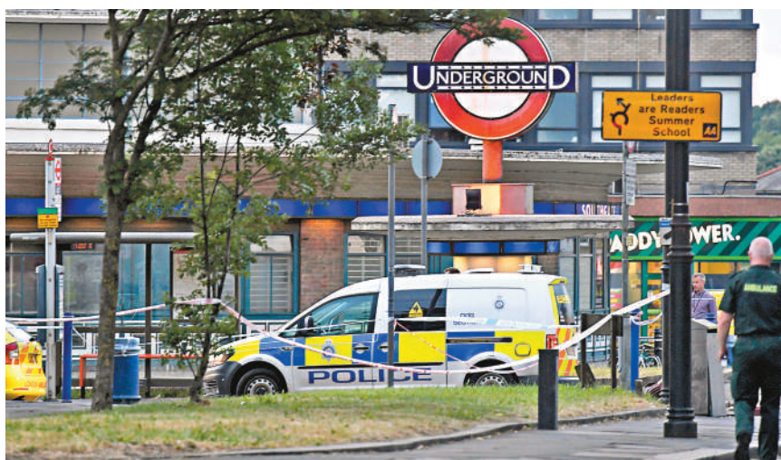
倫敦地鐵南門站前日發生小型爆炸，警方封鎖現場。