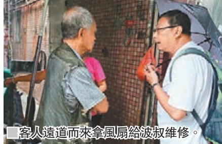
客人遠道而來拿風扇給波叔維修。