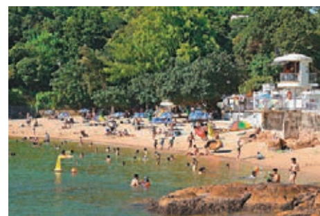
每一次去赤柱泳灘都是愉快的經歷。香港文匯報資料圖片