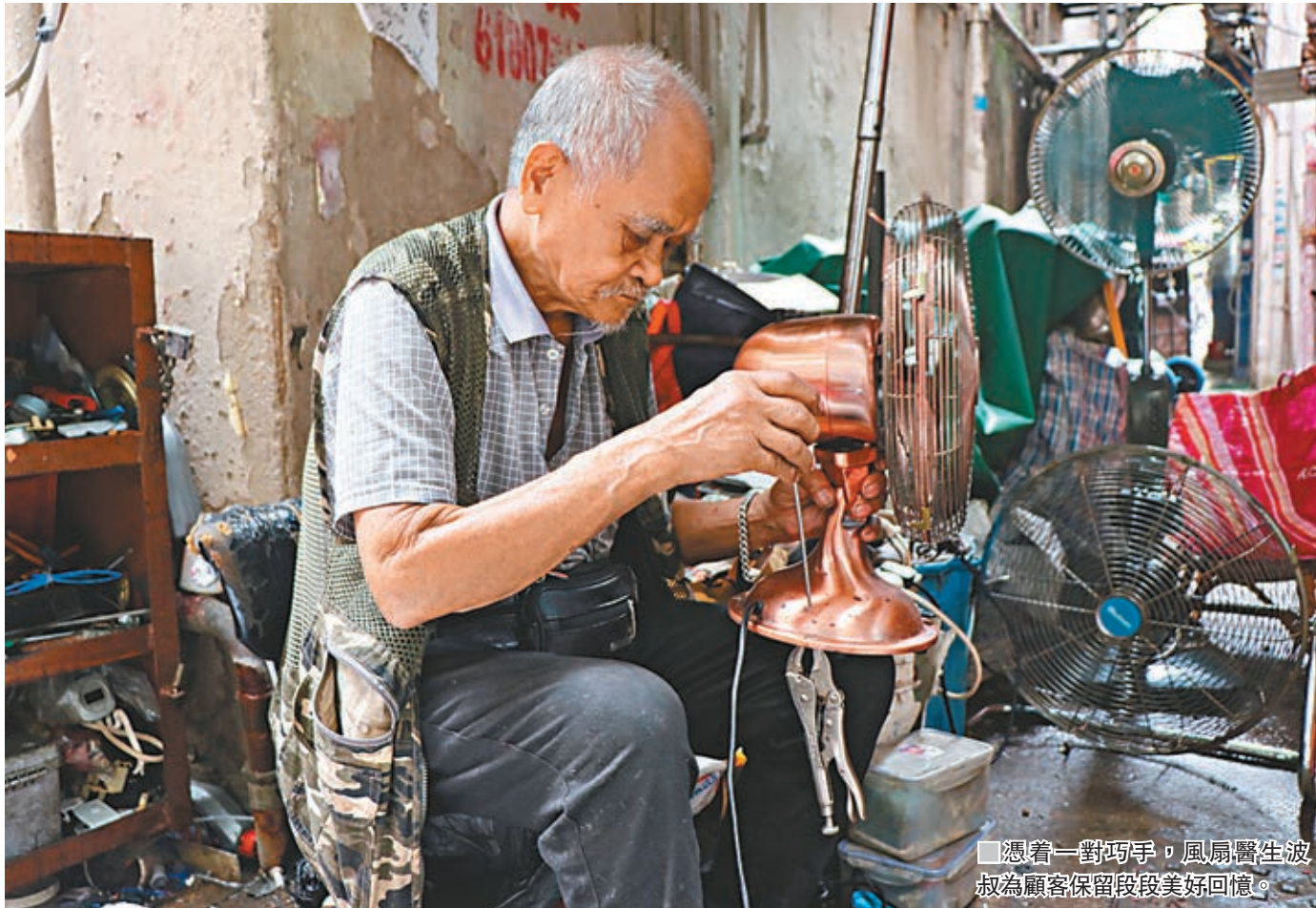
憑着一對巧手，風扇醫生波叔為顧客保留段段美好回憶。