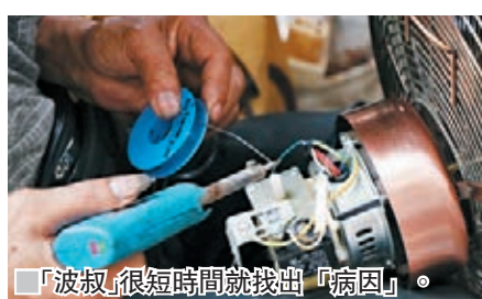
「波叔」很長時間就找出「病因」。