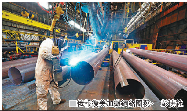
俄報復美加徵鋼鋁關稅。

美國總統特朗普向進口鋼鋁加徵關稅，引發全球貿易夥伴不滿，並紛紛表明採取反制措施。俄羅斯經濟發展部長奧列什金昨日稱，俄羅斯將向美國部分商品徵收關稅，回應美國加徵鋼鋁關稅，並指有關措施不會影響俄羅斯的宏觀經濟表現。