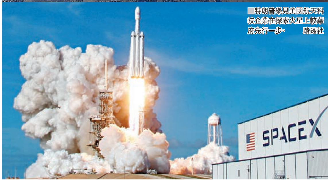
特朗普樂見美國航天科技企業在探索火星上較華府先行一步。