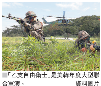
「乙支自由衛士」是美韓年度大型聯合軍演。