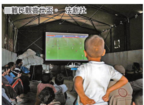
難民觀賞世盃。法新社

極端組織「伊斯蘭國」(ISIS)於2014年佔領敘利亞大部分地區，拉卡市居民穆罕默德憶述，ISIS當時突擊搜查直播上屆巴西世界盃的咖啡室，驅趕球迷回家祈禱，他指責ISIS剝奪了居民許多美好事物，包括體育運動，現時在難民營內終可感受到欣賞世界盃的興奮心情，同時期望能重返家鄉觀賞下屆世界盃。 ■法新社