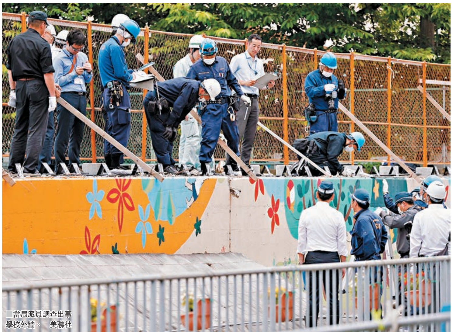
當局派員調查出事學校外牆。