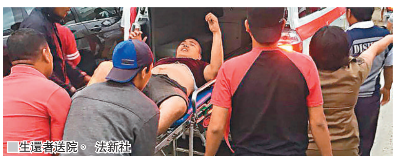
生還者送院。