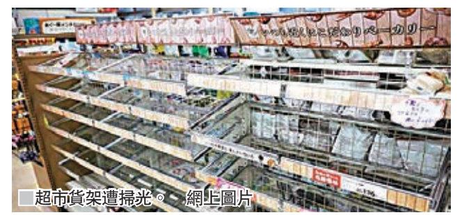
超市貨架遭掃光。網生圖片

震央所在的大阪府北部，居民在地震發生後蜂擁到超市搶購食物及飲品，許多超市的貨架已無任何存貨。高槻市一間超市的瓶裝水及瓶裝茶，在前晚已被搶購一空，即食麵及急凍食品等亦被掃光。超市經理表示，原先計劃翌日出售的貨品也已售光，店方貼出通告，希望顧客理解情況。一名56歲家庭主婦表示，她到過5家超市，但一瓶水也找不到。 ■日本《每日新聞》