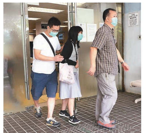
■ 案發時因公幹離港的28歲長女(中)，昨晨在探員及親友陪同下往殮房認屍，顯得傷心不已。

據 悉，早於今年4月，一名自稱「白馬嘯西風」的網民，在網上討論區發貼埋怨濕疹所帶來的苦況，上周五(15日)「白馬嘯西風」再在網上討論區，聲稱要「學術討論」，並以「氣氣自殺有無得諗？」為題發帖，其間圍繞獲救率及是否舒服等問題。