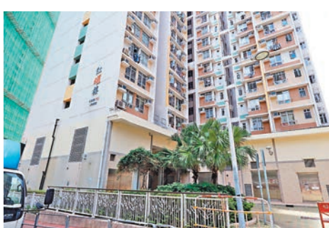
■ 一名居於紅耀樓的77歲老婦疑誤墮網上騙案。

直至近日，家人發現黃婆婆行為有異，經詢問獲悉她向一位素未謀面的網上朋友借出巨額金錢，思疑遇上騙案，黃婆婆聞