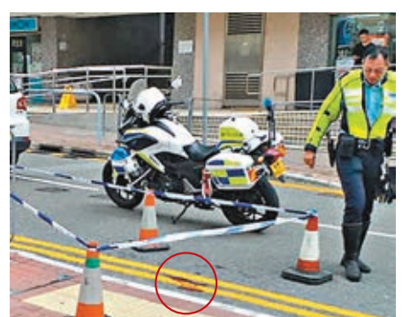
■ 意外後，警員封鎖現場。地上遺下一攤血漬(紅圈示)。