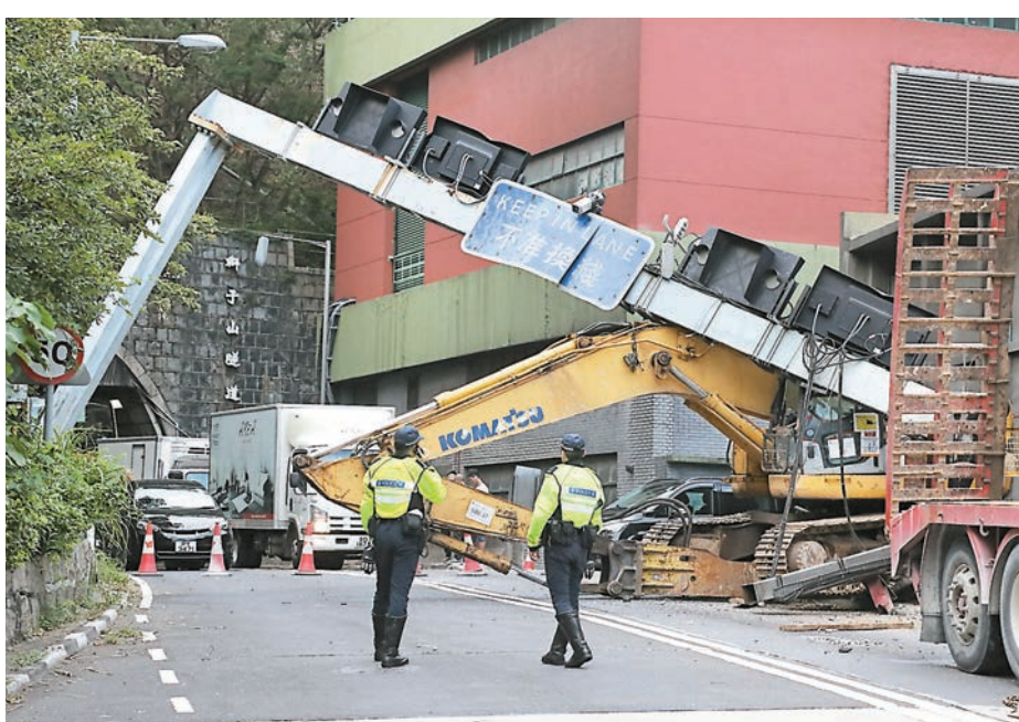
■ 意外中，工程車在駛出獅隧時，疑所運載的挖泥機跌出撞塌龍門架，警方需要封路進行處理。

在交通意外事故中，若涉及有道路設施因有關事故被損毀，政府可循民事途徑向涉事者追討有關損失。一般而言，署方收到警務處調查報告後，會首先派員實地視察，以決定需要維修的範圍，然後會根據維修合約所列費用，再加上其他費用如部門行政費等，向負責人發出付款通知書追討賠償。