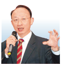
黎偉成 資深財經評論員