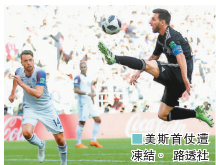
■美斯首仗遭凍結。

的殺傷戰術，這位巴西球星似乎失去冷靜，仍然選擇強行突破全場惹來十次犯規，最終巴西被1：1逼和。尼馬要以領袖的身份帶領巴西奪冠，心理素質尚有改善空間。