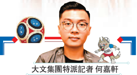
大文集團特派記者 何嘉軒