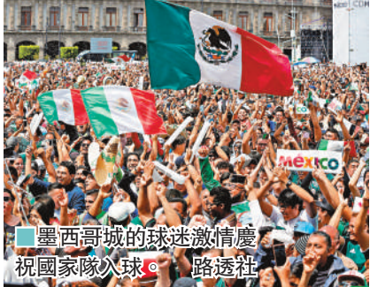
■墨西哥城的球迷激情慶祝國家隊入球。

德國自1982年以來，從未在分組賽首仗輸球，俄羅斯時間周五晚面對墨西哥，於第35分鐘便告失守，夏榮羅辛奴接應隊友傳送妙射入網。不久之後，墨西哥政府相關部門發佈消息稱，幾乎於同一時間墨西哥城監測到持續輕微地震，而且從地震波形分析