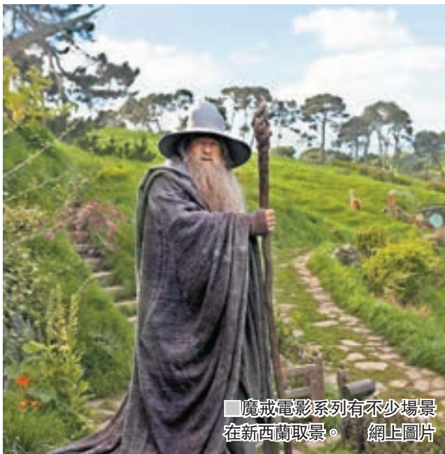
魔戒電影系列有不少場景在新西蘭取景。