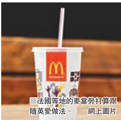
法國等地的麥當勞打算跟隨英愛做法。網上圖片