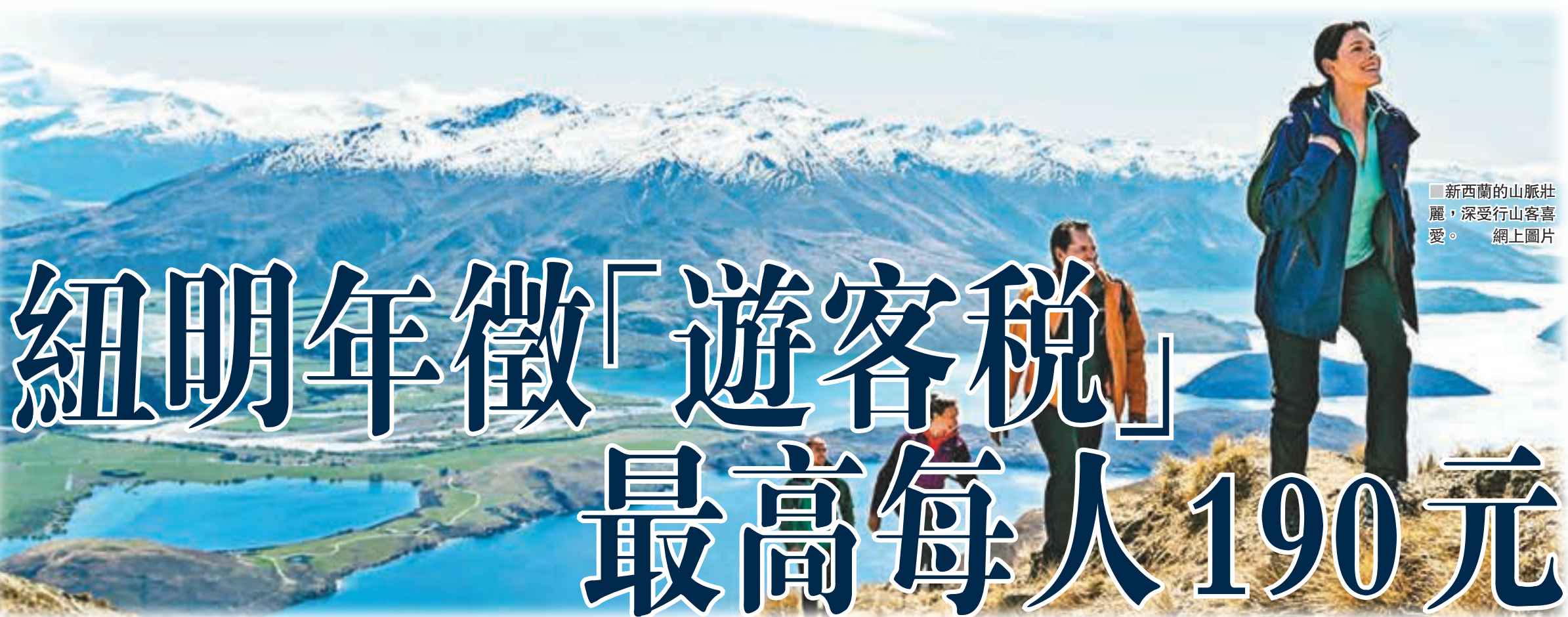
新西蘭的山脈壯麗，深受行山客喜愛。