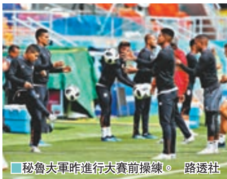
秘魯隊昨進行大賽前操練。

法國近年出產多名年輕新星，今次23人大軍名單中，差不多每個位置都有球迷耳熟能詳的球員可供調動，被認為是今屆世界盃熱門之一絕對合情合理。無疑，一支球隊每個位置均星光熠熠，並不代表就可以團結起來齊心作戰，例如2010年世界盃時，法國隊並曾試過出現集體罷訓事件，軍心大受影響下，最終於分組賽便告出局。