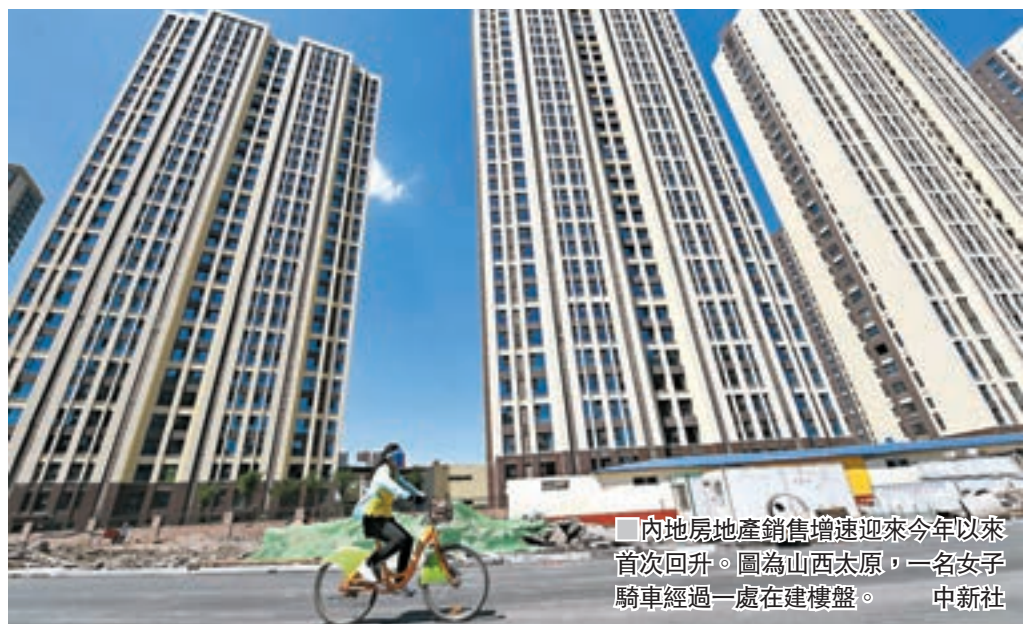
內地房地產銷售增速迎來今年以來首次回升。圖為山西太原，一名女子騎車經過一處在建樓盤。

香港文匯報訊（記者 海巖 北京報道）隨着二三線城市房地產持續升溫，內地房地產銷售增速迎來今年以來首次回升，商品房庫存則繼續下降至46個月來新低。同時，房地產投資增速連續三個月保持在10%以上高位。另外，從整體經濟看，5月工業生產平穩，但消費增速意外降至15年來低點，投資增速則創歷史新低。專家預計二季度經濟仍有望錄得較好表現，但下半年增長或存隱憂。