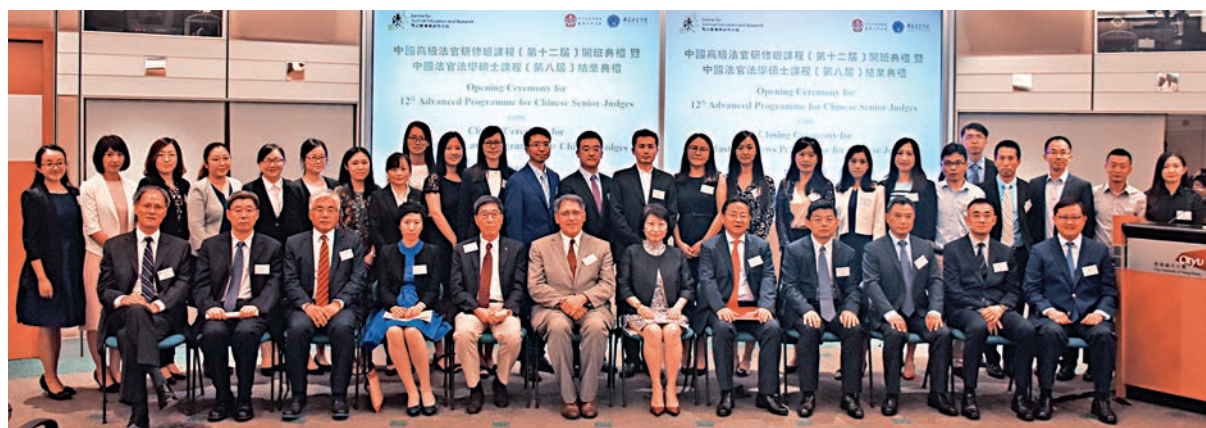
中國法官法學碩士課程(第八屆)學員與主禮嘉賓合影