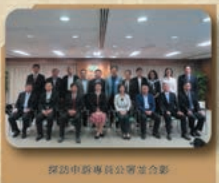
探訪中國檢察總長辦公處合影