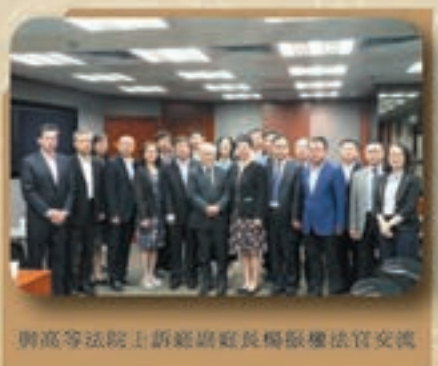
與高等法院上訴庭副庭長楊振權法官交流