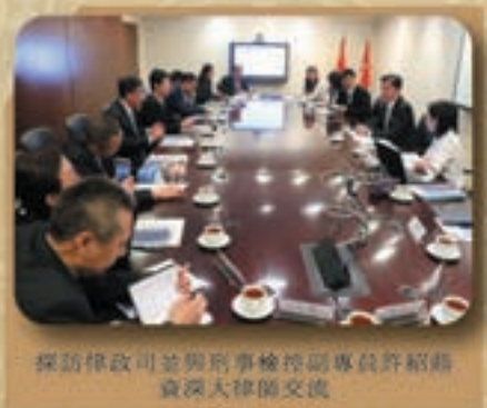
探訪律政司司長與副司長許冠文資深大律師交流