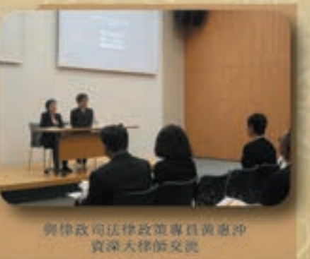
與律政司法律政策專員黃惠卿資深大律師交流