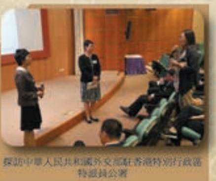
探訪中華人民共和國駐香港特別行政區總領事館