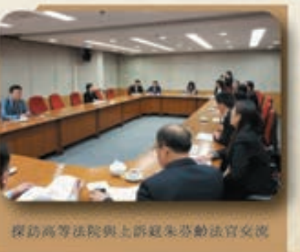
探訪高等法院與上訴庭法官交流