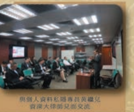
與個人資料私隱專員黃繼兒資深大律師見面交流