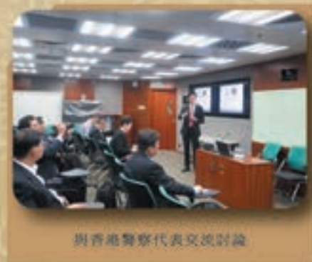
與香港警察代表交流討論