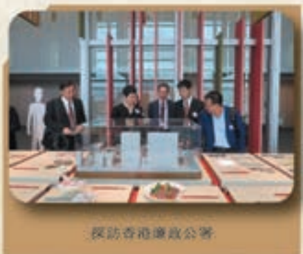
探訪香港政府公署