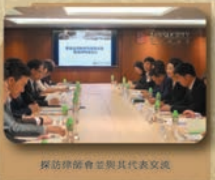
探訪律師會並與其代表交流