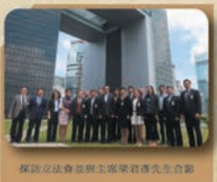
探訪立法會與主席梁君彥先生合影