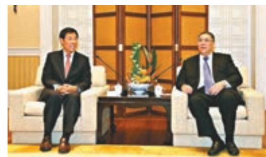
■ 崔世安(右)與姜在忠交流。