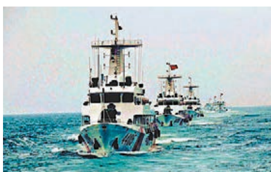
■ 廣東海警開展了「南海—2018」實兵對抗演練暨編隊巡邏訓練。 網上圖片

本次巡邏結合伏季休魚、綜合執法、掃黑除惡行動、海上訓練等相關活動進行，巡邏範圍覆蓋三千多公里陸岸線，自以上相關活動開展以來，廣東海警嚴格落實上級部署要求，派遣多艘艦艇對轄區，特別是案件高發區進行定期及隨機巡邏，查獲各類案件多宗，並深入轄區海域對「海上110」加大宣傳，處理多宗海上求助警情。