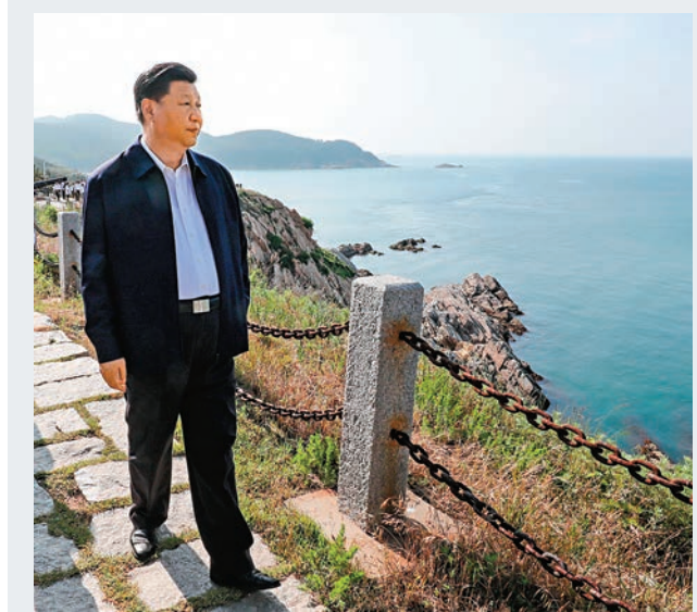
■ 習近平12日在山東膠東（威海）黨性教育基地劉公島教學區察看北洋海軍炮台遺址。

習近平說，我一直想來這裡，來感受一下，受教育。要警鐘長鳴，銘記歷史教訓，13億中國人要發奮圖強。