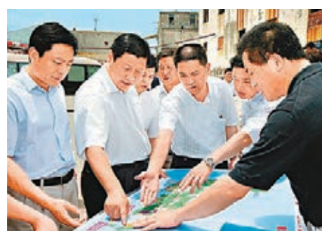
■ 2005年6月13日，習近平在浙江舟山岱山大衛島調研海洋經濟，察看鼠浪湖港區規劃。

「發展海洋經濟是一項功在當代、利在千秋的大事業。」在浙江工作期間，習近平13次來到舟山，足跡遍佈大小島嶼。2003年1月，習近平第一次到舟山時說：「做好海洋經濟這篇文章，是長遠的戰略任務，我們要加强調查研究，從實際出發，一如既往地抓下去。」2003年8月18日他主持召開全省海洋經濟工作會議，拉開浙江加快建設海洋經濟強省的序幕。