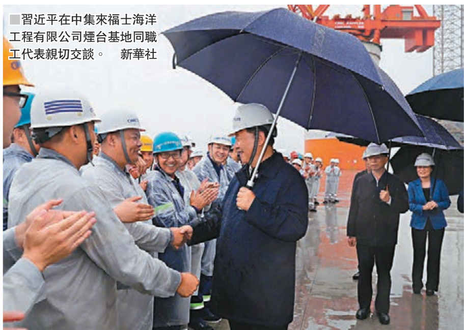
■ 習近平在中集來福士海洋工程有限公司煙台基地同職工代表親切交談。

香港文匯報訊 在出席上海合作組織青島峰會後，中共中央總書記、國家主席、中央軍委主席習近平在山東考察。據新華視點報道，13日，習近平先後來到萬華煙台工業園和中集來福士海洋工程有限公司煙台基地。習近平在考察工業園時強調，國企要搞好就一定要改革，抱殘守缺不行，取得成功要走自主創新之路。習近平在了解高端海洋工程設備自主設計研發製造情況時表示，基礎的、核心的東西是討不來買不來的，要靠我們自力更生、自主創新來實現。