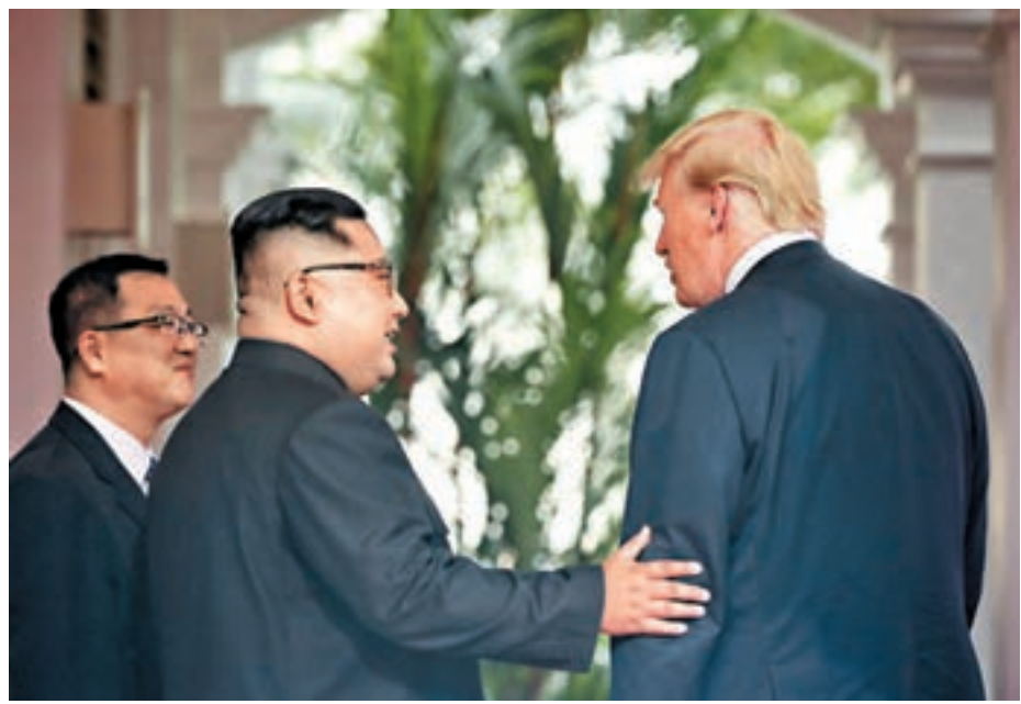
金正恩輕拍特朗普手臂。