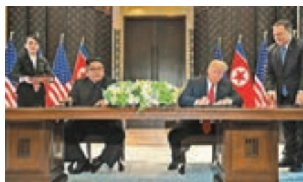
會議桌已有80年歷史。

美朝元首昨日會面以簽署聯合聲明時，使用的會議桌大有來頭，它曾是新加坡最高法院首席法官使用的工作桌，已有80年歷史。