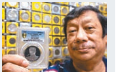
朝鮮硬幣在新加坡受追捧。

朝鮮過往為紀念導彈試射等大事發行硬幣，但因朝鮮受國際社會制裁，紀念幣不能公開拍賣，令收藏家趨之若鶩。由於美朝峰會在新加坡舉行，朝鮮紀念幣的價格在當地水漲船高，更吸引許多新加坡收藏家加入爭奪，令擁有朝鮮硬幣的新加坡錢幣商人發了一筆意外之財。