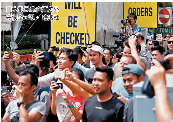
大批長線在酒店外守候金正恩。

韓國民間非常關注美朝峰會，多名演藝界人士於社交網站Instagram送上祝福，期望峰會帶來和平，有國民於工作時間偷看峰會直播，認為峰會對韓國影響深遠。在首爾火車站，大批乘客駐足圍觀電視直播，美國總統特朗普和朝鮮領導人金正恩握手一刻，現場即時爆發出歡呼聲與掌聲。