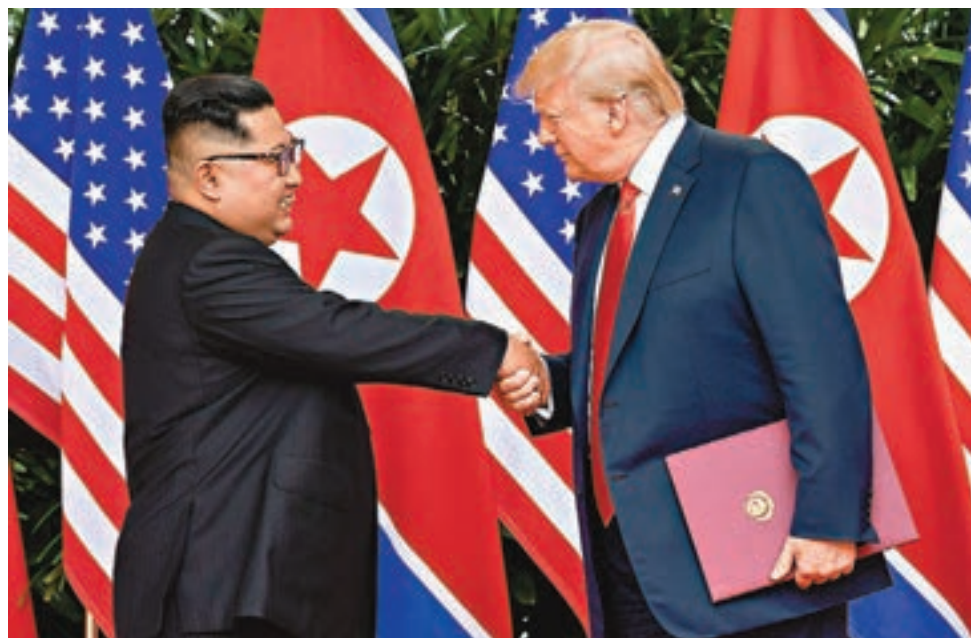
特朗普與金正恩握手時互有拉扯。