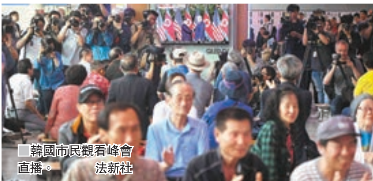
韓國市民觀看峰會直播。

開城工業園區韓企協會會員企業人員昨日聚集在首爾辦公室，收看峰會直播，當金正恩與特朗普握手時，一直屏氣凝神的企業家一起鼓掌歡呼，對園區恢復運作寄予厚望。