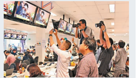
記者在新聞中心忙碌工作。

造成兩次峰會氣氛出現如此重大落差，一方面可能是因為會議在中立場新加坡舉行，沒有板門店所象徵的歷史意義；朝鮮這對分屬南北的至親關係，亦遠比美國和朝鮮之間只有對立的過去，更能讓人產生共鳴。事實上，特金會給人的感覺更像是一次平常的領導人峰會，過程亦非常倉促，會後金正恩先走一步，留下特朗普獨自一人主持記者會，更讓人覺得雙方只是「為會面而會面」。