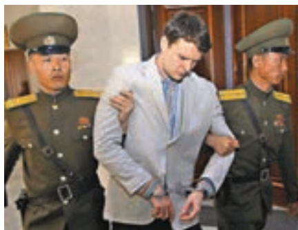
已故美國大學生瓦姆比爾。資料圖片

特朗普表示，瓦姆比爾死亡是可怕和殘忍的事，但也觸發包括朝鮮在內的各方關注，此後「開始發生了一些事情」，形容若沒有瓦姆比爾，美朝峰會便無法成事。特朗普透露昨日曾跟金正恩談到朝鮮人權，相信對方將採取正確行動。