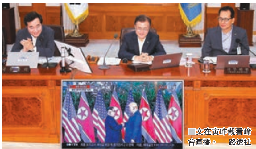
文在寅昨觀看峰會直播。

韓國總統文在寅昨日發表聲明，讚揚美朝峰會的成果是「歷史大事」，將促使全球僅餘的冷戰局面走向終結，共同譜寫和平與合作的新篇章。文在寅昨晚與美國總統特朗普通電話，讚揚特朗普為世界和平奠定基石，是韓美首腦連續兩天通電。