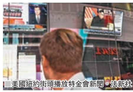
美國紐約街頭播放特金會新聞。