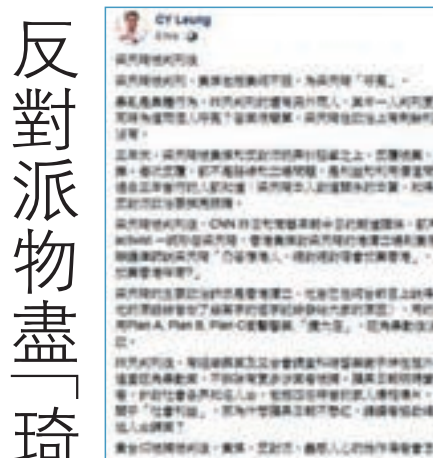
梁振英在fb撰文,指在多名暴徒中,反對派唯獨「聲援」梁天琦,是因為對方仍有利用價值。 fb截圖

香港文匯報訊(記者 甘瑜)「本土民主前線」前發言人梁天琦因暴動和襲警被判刑,一眾反對派竟為他「呼冤」,全國政協副主席梁振英昨日就在facebook撰文點破,在多名暴徒中,反對派唯獨「聲援」梁天琦,是因為對方仍有利用價值,並批評梁天琦所謂的「唔會放棄香港」,說穿了就是其「港獨」主張,亦反映他並無就其破壞社會安寧的行為悔改。 梁振英在文章開首就反問,除了梁天琦,前日還有兩個人被判刑,其中一人的判刑更重,「『黃媒』為什麼不同時為這兩個人呼冤?答案很簡單,梁天琦在政治上有利利用價值,其他兩人沒有。」 他指出,梁天琦3年來遭「黃媒」和反對派玩弄,「反覆被棄、被寵;被踩、被捧」,「每次反覆,都不是路線和立場問題,是利益和利用價值問題……年輕人玩反對派政治要擦亮眼睛。」 就辯護律師為梁天琦塑造「高大形象」,稱梁天琦「仍答應港人,絕對絕對唔會放棄香港」,梁振英提醒大家應當反問:「唔會放棄香港咩(乜)嘢?」 批「獨琦」拒收斂「違論悔改」 他直言,梁天琦的主要政治訴求是「香港獨立」,而他在網台上也承認自己用的手段是借故聚眾,有不同計劃企圖衝擊警署,想「搞大佢」,反映梁天琦在旺角暴動後沒有收斂,「違論悔改」。 梁振英強調,警方仍在追查旺角暴動案,不排除有更多涉案者被捕。《蘋果日報》明碼實價大手筆竊竊讀者,針對社會各界知名人士爆相爆片,他質問道:「如果這些爆相爆片關乎『社會利益』,那為什麼《蘋果日報》不懸紅,請讀者協助緝拿黃台仰等棄梁潛逃人士歸案?」