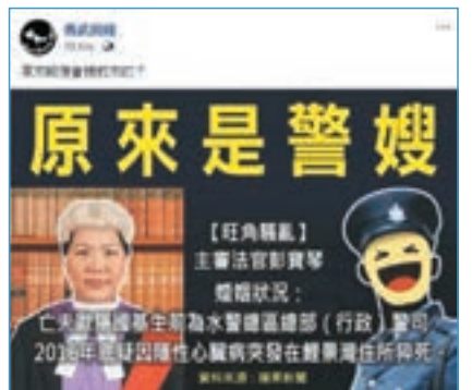
「勇武前綫」狙擊法官,發圖在其喪夫痛上灑鹽。

理」,言行越來越放肆,梁家傑等實為始作俑者。 郭偉強指不反思反誘 工聯會立法會議員郭偉強指出,「港獨」分子的言行反映他們一貫的行事作風,不但未因梁天琦等被判囚而反思,更繼續誘過於人,且通過人身攻擊試圖向法官施壓,毫無道理、道德可言。 邵家輝:詛咒顯冷血無恥 自由黨副主席邵家輝強調,旺暴的事發過程、梁天琦的參與程度,全港市民有目共睹,而法官是根據法律並通過公開、公平、公正的程序判刑。「港獨」分子對法官人身攻擊,十分