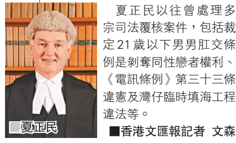
夏正民以往曾處理多宗司法覆核案件，包括裁定21歲以下男男肛交條例是剝奪同性戀者權利、《電訊條例》第三十三條違憲及灣仔臨時填海工程違法等等。 ■香港文匯報記者 文森

夏正民曾查高鐵工程延誤 政府成立獨立調查委員會調查沙中線紅磡站「短筋」事件，並宣佈由前終審法院非常任法官夏正民負責調查。行政長官林鄭月娥昨日指出，夏正民對香港鐵路監管事宜並不陌生，因他在2014年曾擔任跟進廣深港高鐵（香港段）延誤而成立的獨立專家小組主席。 夏正民當年用了6個月時間調查高鐵工程延誤，最終報告狠批路政署監管港鐵不力、無視獨立顧問警告、又向運輸及房屋局隱瞞延誤和超支問題。港鐵亦被批評匯報混亂及蓄意隱瞞，令政府被蒙在鼓裡。 現年73歲的夏正民於1983年移居香港，歷任律政署檢察官、高級檢察官、副首席檢察官。1991年離開政府加入司法機構，出任地方法院法官，1998年任高等法院原訟法庭法官，2008年任高等法院上訴法庭法官。2012年7月退休，留任終審法院非常任法官至2016年8月。