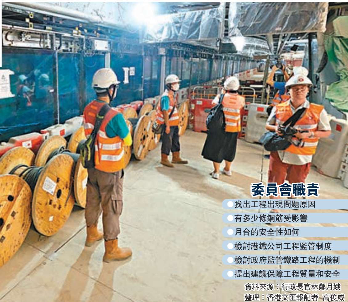
資料來源：行政長官林鄭月娥 整理：香港文匯報記者 高俊威

香港文匯報訊（記者 高俊威）港鐵沙中線紅磡站月台鋼筋被剪短事件仍有不少疑團未解，行政長官林鄭月娥昨日宣佈，將成立獨立調查委員會全面調查事件，並盡快就委員會的職權範圍及組成等細節，向行政會議匯報及尋求批准。她指出，政府已物色前終審法院非常任法官夏正民出任委員會主席，期望委員會可在展開工作後6個月內向政府提交報告。她強調，如果紅磡站不安全，就一定不可以開通。