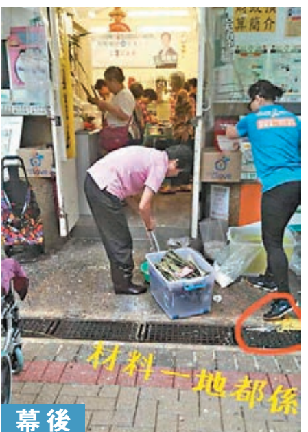
幕後 橫橫橫兩渠邊包糉,啲材料仲要一地都係,仲加隻腳踩吓,冇有人重口味到會食先?班糉工係係多得你唔少!

網民「Greedy Cat」就留言狠批:「唔好出左(咗)事就賴糉工心急所致啦!一啲責任感都無,人地(哋)好心幫你,有事你就賴人,痴(癡)線!」「Kin Hung Chan」也道:「糉工都係聽你地(哋)點講佢點做姐(啫),唔好將責任推去糉工到(度),你咁講令到幫你既