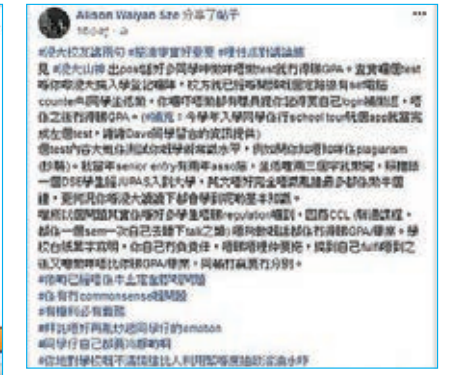
浸大校友駁陳樂行謬論(上圖),但你知道鍵盤戰士唔夠人,扣人五毛或左膠帽子就當贏喇(下圖)。