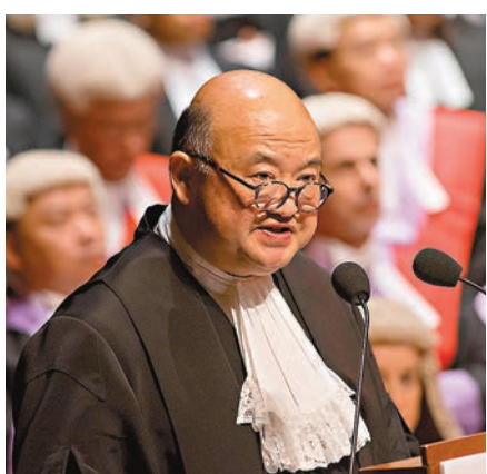
馬道立指有人以自己的立場去攻擊法院裁決,忽略法庭本身職責。資料圖片

香港文匯報訊(記者 陳川)由反東北發展衝擊立法會、「佔中」前衝擊政總東翼前地到旺暴案,反對派中人為了政治目的,不斷攻擊法院的裁決。特區終審法院首席法官馬道立昨日指出,法庭在審理具爭議的政治、經濟或社會事件時,不少人將自己對某事件的牢固立場、自己對法律的看法,與法庭的裁斷結果劃上等號,忽略了法庭只是依法裁斷法律爭議。他認為,必須正確讓普羅大眾認識法律如何運作,否則當社會大眾失去信心,再好、再備受讚譽的體制也不會成功。