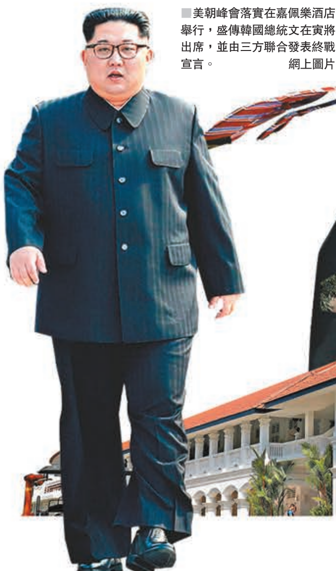
美朝峰會落實於嘉佩樂酒店舉行，盛傳韓國總統文在寅將出席，並由三方聯合發表終戰宣言。 網上圖片

1984年6月4日，正在考大學的美保前往圖書館，自此下落不明。她的電單車隔日被發現停在附近一個火車站，手袋則掉在360公里以外的偏僻海邊，距離其他兩名被朝鮮綁架日本人被擄的地方不遠。 ■路透社