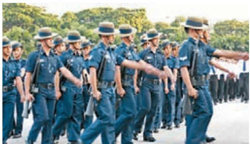
啞喀兵成為美朝峰會衛士。

■新加坡《海峽時報》/新加坡亞洲新聞台/美國有線新聞網絡/澳洲廣播公司/韓聯社/路透社/共同社