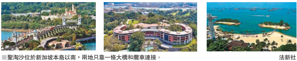
聖淘沙位於新加坡本島以南，兩地只靠一條大橋和纜車連接。

美朝峰會落實於周二在新加坡聖淘沙嘉佩樂酒店舉行，令這座面積僅5平方公里、馬來語中意為「寧靜」的小島，成為全球焦點。分析相信峰會會場之所以選在聖淘沙，而非擁有較多舉行國際會議經驗的市中心酒店，原因與聖淘沙的島嶼地形、較易部署保安安排有關。新加坡政府宣佈峰會期間加強保安，屆時將設立空域管制，軍方更特別派出啞喀兵駐守嘉佩樂酒店一帶，確保峰會順利舉行。