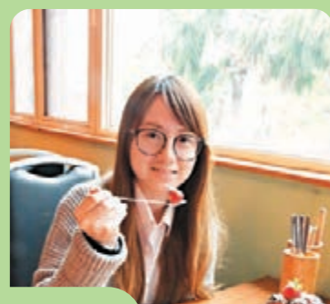
品嚐美味的巧克力草莓。