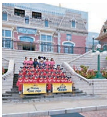
幼稚園畢業相在迪士尼拍攝幾有新意。

同時，這兒還新設了洋溢非洲風情的「加利布尼市集」，在探險世界「原野劇場」旁，大家可以參與一系列互動遊戲，如加利布尼幸運輪、部族投球及市集彈珠等小遊戲，需要購買遊戲券，買5送1，或購買指定產品可參與遊戲一次，贏取多款獨家紀念品，亦可在市集內享用不同特色小食。而且，市集內，多個喜愛冒險的迪士尼朋友，如《沖天救兵》卡叔和羅小飛、《小泰山》的巴魯和路易王、《獅子王》的拉飛奇和丁滿、《阿拉丁》茉莉公主和精靈，還有史迪仔與妮露等亦會輪流與賓客見面。