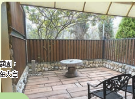
開放式的前庭園，真的可以享受在大自然之中放鬆。