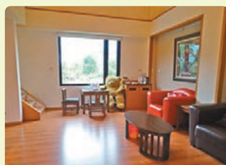
大廳配上整面對外山海樹窗景。