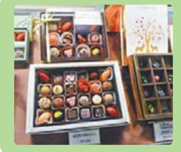
不同形狀的巧克力非常精緻