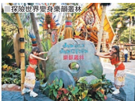
探險世界變身樂韻叢林