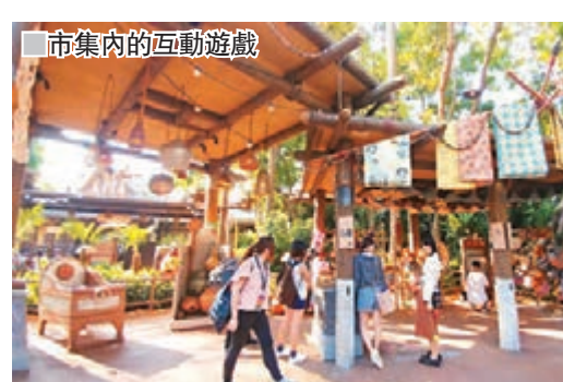
市集內的互動遊戲