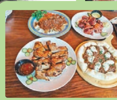
餐廳提供創意美食