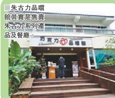
朱古力品嚐館其實是售賣朱古力系列產品及餐廳。