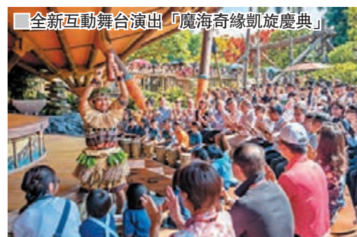
全新互動舞台演出「魔海奇緣凱旋慶典」