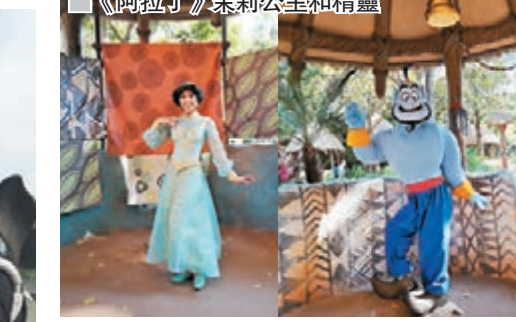
《阿拉丁》茉莉公主和精靈

本版「閒遊香港」欄目，藉以尋覓香港有特色及鮮為人知的秘景，歡迎來稿跟讀者分享，需圖文兼備，字數以800至1,000字為宜，圖片5張以上，請勿一稿多投。如獲刊登，將致薄酬。