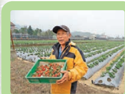
大湖草莓園有新鮮草莓摘