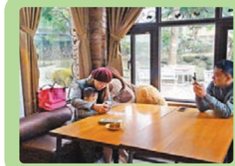
一家人做巧克力DIY體驗