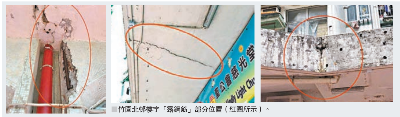
■竹園北邨樓宇「露鋼筋」部分位置(紅圈所示)。

少於500萬元維修裂痕，但屋邨居民主要是貧苦大眾，「我們是老人家，你叫老人家何來這麼多錢，去維修這個龐大的缺陷？」