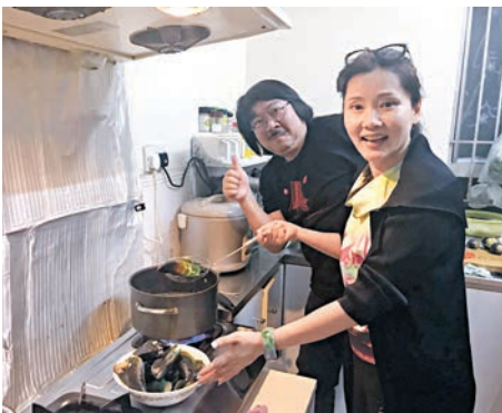
■葉教授讚飛姐是一位出得廳堂入得廚房的女人。

有什麼關係？有呀，就是因為她的性格，又因為是炎熱天氣，她冒熱和葉教授到市場買菜，為的是到我家作客吃飯，此舉真令人感到溫暖，還不單止買菜，還下廚烹調，一味酸菜魚已經吃得我們停不了嘴！ 其實，她來香港幾天還有很多正事要辦，卻為了我們忙碌了半天，讓我們度過一個開心美味的晚上，吃上一頓藝術家的晚餐，在那熱暈了的夜晚！ 飛姐經常來往，上海、香港兩邊飛，有時還要飛去北京，稍後她會參加新劇的演出。不過，她很享受這種生活，總之自己覺得自在就得了！她笑着說：「我有我忙，先生有先生忙，兒子有兒子忙，大家各做各事。但不過我們又很知道彼此的狀況！」