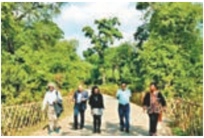
■我們進入邁古茶樹林。

山下雲海茫茫，山間繚繞着白蒙蒙的霧海。這便是普洱茶樹的原產地和中心地帶。這裡古茶園佔地面積二萬八千畝，採茶面積一萬二千畝。 這些千年古茶樹，其實並不特別聳拔，與森林喬木混生，一般生長在參天大樹掩映之下。 因樹齡特別高，歷經滄桑，長滿苔蘚、藤蔓、寄生蘭花、野菌類等。 據同行的一位拉祜族姑娘說，在千年古樹上寄生一種「螃蟹腳」的植物，比普洱茶更名貴，對治療癌症很有功效。 可惜我們找遍古茶樹，仍未發現「螃蟹腳」。 拉祜人說，如果找到「螃蟹腳」，就是找到幸福的人——幸福離我們這些現代人何其遠也！（《我與普洱》之四）