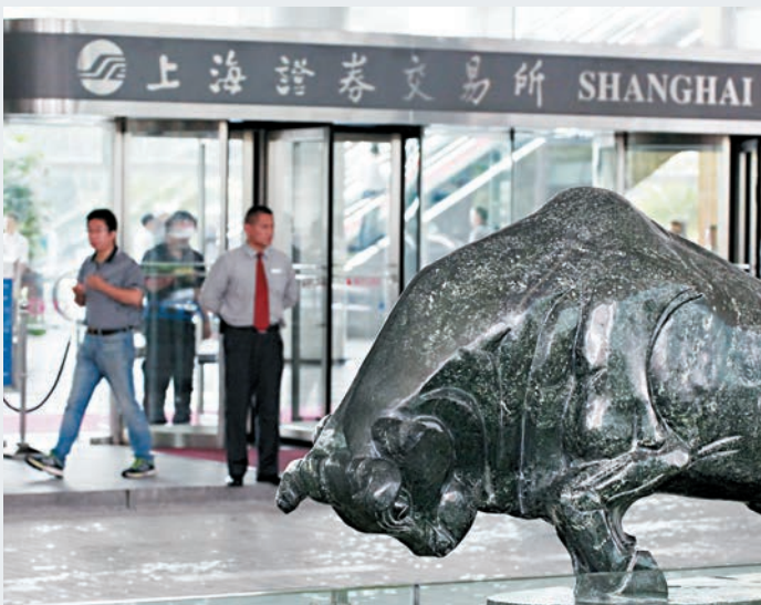
內地正討論在上交所設新交易板塊，以吸引包括生物科技等創新科技公司首發。

香港文匯報訊 內地加大力度吸引企業到A股上市。綜合彭博以及內地媒體報道，包括中國證監會和科技部在內的多個政府部門，正在討論在上交所設立新的交易板塊的計劃，以吸引包括生物科技等創新科技公司首發。另外，有6家獨角獸戰略配售公募基金產品，今日將拿到產品批文，這6隻產品的整體規模介於50億至500億元（人民幣，下同），封閉期三年，每6個月開放受限申購，只能申購，不能贖回。