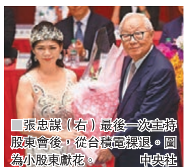
張忠謀(右)最後一次主持股東會後,從台積電退選。圖為小股東獻花。

香港文匯報訊 綜合台媒報道,台灣積體電路製造股份有限公司(台積電)董事長張忠謀昨日正式退休,86歲高齡的他當天最後一次主持股東會指出,相信新領導階層能夠順利接班。