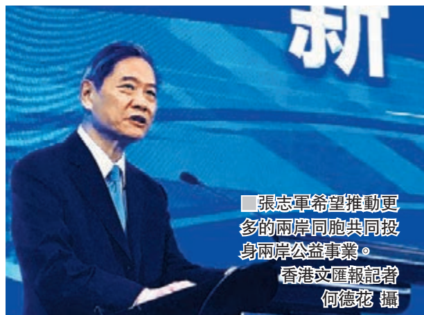
張志軍希望推動更多的兩岸同胞共同投身兩岸公益事業。

香港文匯報訊(記者 敏敏輝 廣州報道)廣州市環保局近日正式公佈穗莞深城軌琶洲支線環評公示資料,表明這一線路即將開工建設。據悉,此城軌支線不僅將城軌引入廣州中心城區,亦將穗莞深佛惠五個珠三角核心城市直接串聯起來。而今後,這種珠三角城市城軌互聯互通建設將進一步加速。目前,廣東已啟動編制《粵港澳大灣區城際鐵路建設規劃(2020-2030)》,推進「環線+放射線」的珠三角城際鐵路網建設,進一步完善環大灣區城際軌道網。