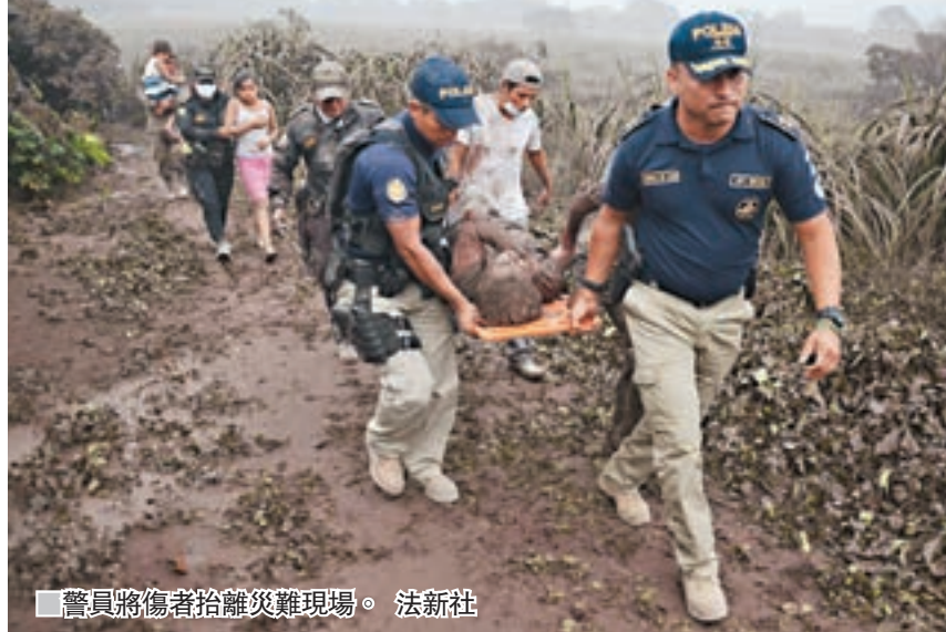
警員將傷者抬離災難現場。

危地馬拉的富埃戈火山前日爆發，噴出大量火山灰和流出熔岩，造成至少38人死亡，其中包括3名兒童，另有近300人受傷。今次是富埃戈火山本年内第二次爆發，亦是逾40年來最猛烈，部分避難者被熔岩活埋喪生，首都危地馬拉城國際機場需關閉。總統莫拉萊斯宣佈全國進入橙色警戒狀態，埃斯昆特拉省和奇馬爾特南戈省等重災區更頒佈紅色警戒。 碎屑流逾700度高溫 海拔3,763米的富埃戈火山位於危地馬拉城西南約40公里，噴出的火山灰高達1.1萬米，覆蓋附近20平方公里區域。傳媒片段顯示，熔岩流向埃爾羅德