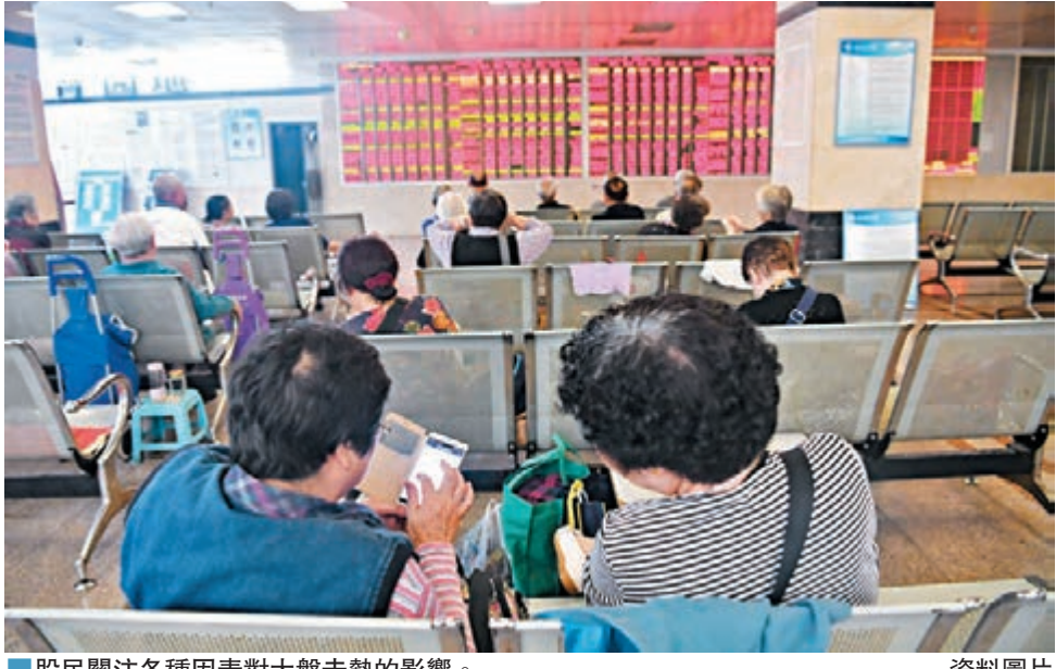
股民關注各種因素對大盤走勢的影響。