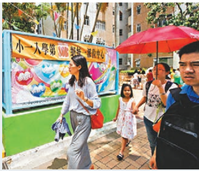
仍有許多家長攜子女奔波「叩門」，搶報更心儀學校。