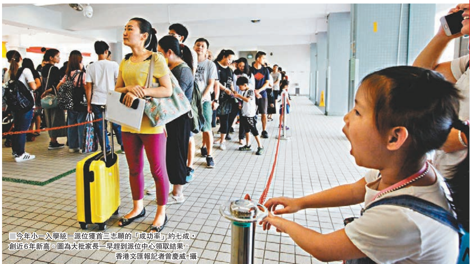
今年小一入學統一派位獲首三志願的「成功率」約七成，創近6年新高。圖為大批家長一早趕到派位中心領取結果。