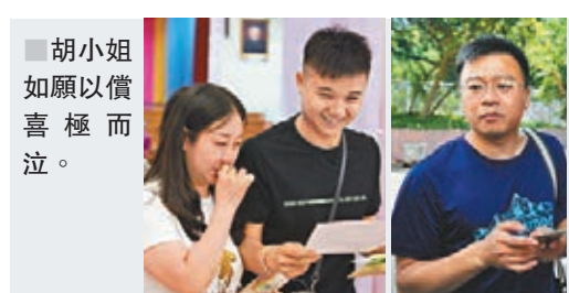
胡小姐如願以償喜極而泣。