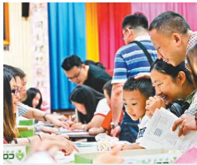
家長焦急查閱子女派位結果。