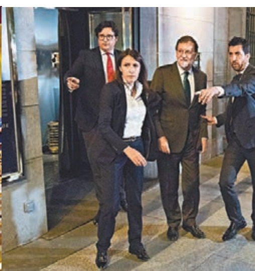
拉霍伊被發現躲在一間餐館。