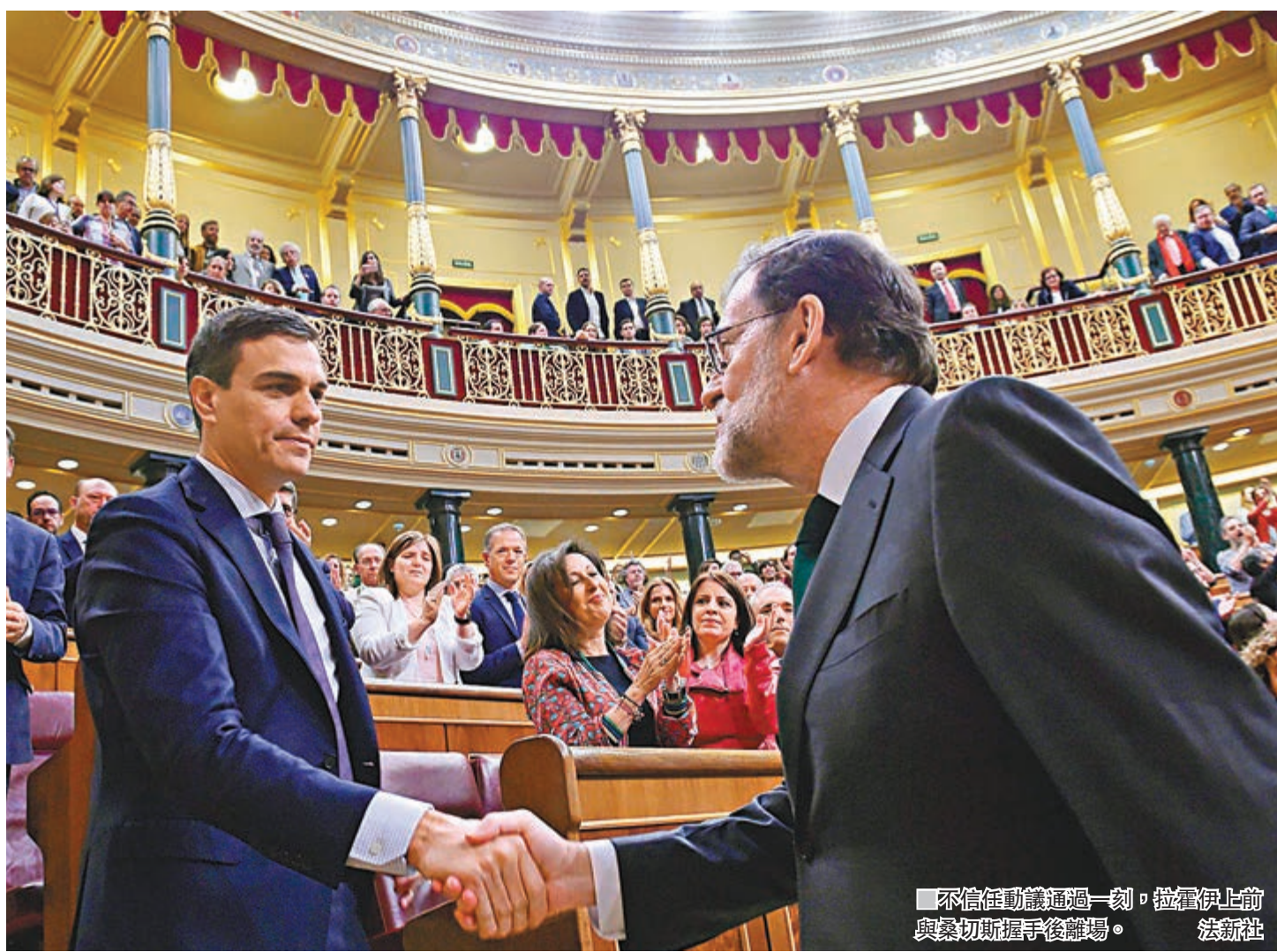
不信任動議通過一刻，拉霍伊上前與桑切斯握手後離場。