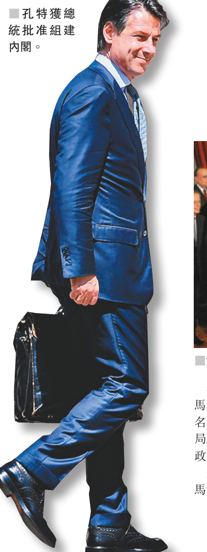
孔特獲總統批准組建內閣。