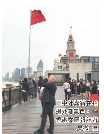
中外嘉賓在拍攝外灘景色。

據涵蓋交易、交易後處理、信息、增值、監管等服務領域51個系統的外匯交易中心記錄,2017年銀行間交易量達到998萬億元(人民幣,下同),在包括銀行間市場、股票市場、期貨市場、黃金市場在內的全國主要金融市場體系中,銀行間市場交易量佔比超70%。另據清算所統計,截至2016年,債券市場清算金額增長速度達到302%,業務累計清算額9.22億元,累計清算會員數達到65家。