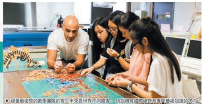
視覺藝術院的教學團隊約有三分之二來自世界不同國家,培訓擁有國際視野及專門藝術知識的人才。