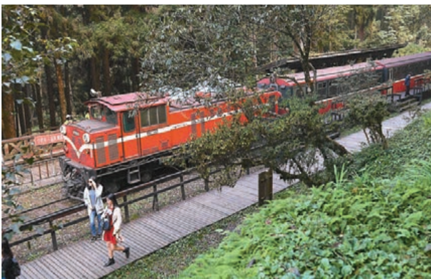
■ 台當局嚴審陸團，重挫島內旅遊業。圖為遊客稀少的阿里山景區。 資料圖片

李奇嶽說，以專做觀光的陸客旅行社來說，馬英九時代約400多家有資格，實際接團的有100多家。