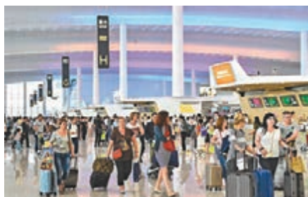
在飛機上尋釁滋事、在機場安檢中堵塞、強佔、衝擊安檢通道等行為都將被列入失信人名單。圖為廣州白雲機場T2航站樓。

而且，樂視系公司已經25次被列為失信被執行人，涉及公司包括樂視控股、樂視移動、樂視體育等。按照《最高人民法院關於限制被執行人高消費及有關消費的若干規定》第三條規定，被列為失信被執行人的自然人，將被採取限制