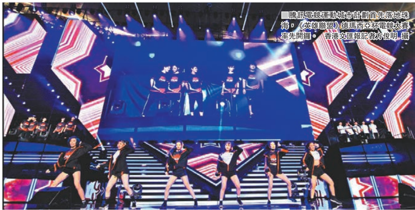
騰訊電競運動城市計劃首個落地珠海，《英雄聯盟》德瑪西亞杯電競大賽率先開鑼。

「電競或將成為香港下一個經濟增長板塊。」來自普華永道的報告認為，香港可望成為未來亞洲的電競中心。而中山大學珠港澳研究中心專家指出，香港可在創意經濟、電子信息服務業、知識產權保護以及電競產業政策等方面發揮優勢，與廣東的IT人才、消費市場和遊戲設計等「互補發展」。對此，香港電競總會方面建議，特區政府要在資金、場地、稅務優惠等加強對電競產業特別是初創企業的扶持，逐步構建起整個電競產業鏈。