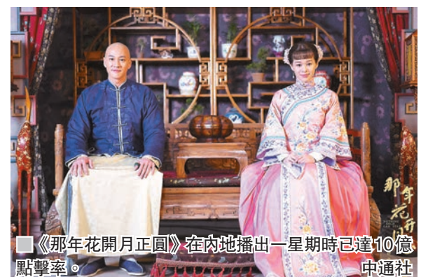
《那年花開月正圓》在內地播出一星期時已達10億點擊率。