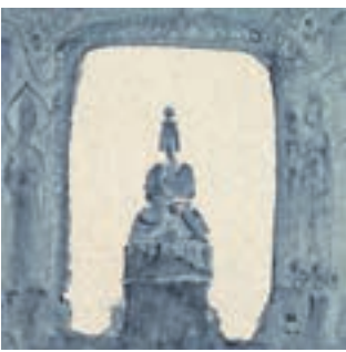
獨坐千年之一——漢魏古風，似與不似之間寫意地表達了時間的沉澱。