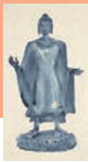
獨坐千年之三十一——無靈

水井街區，對秦磚漢瓦習以為常，在這種環境中成長，他耳濡目染，對石雕刻逐漸有了愈來愈多的個人理解。他認為，藝術創作無論何時都是開始，不受年齡的限制，每一個階段對自我和社會的認識不同，想通過藝術表達的內容也各不相同，過程中有眼光的提高，也有成長的印記。「一幅畫的技法問題，我們在上學的階段已經解決了，之後便是藝術意識的呈現，是和自己自己的對話，繪畫境界會跟隨思想層次而提高。」