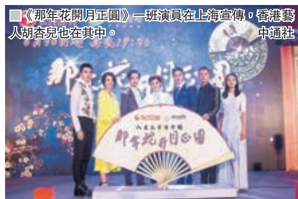
《那年花開月正圓》一班演員在上海宣傳，香港藝人胡杏兒也在其中。