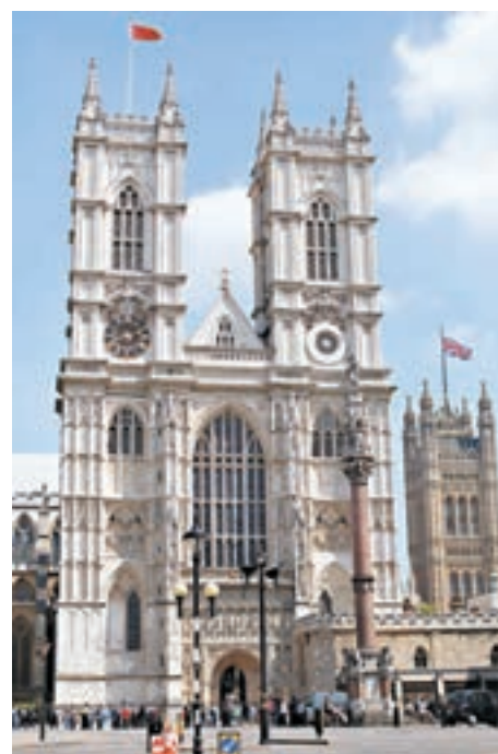
能被安葬在西敏寺，可以說是一項莫大的榮譽。

西敏寺與英國皇室有着深厚的淵源：這裡是國君加冕 (coronations)、皇室婚禮 (royal weddings) 及安葬 (Burials) 的地方。因此，西敏寺就與英國國君人生中多個重要的時刻扣連在一起。例如亨利七世 (Henry VII) 就是分別在 1485 年及 1486 年在西敏寺加冕與結婚，現在還長眠於此。 不過亨利七世是少數「集齊一套」的人，更多的國王是只在西敏寺舉行一兩個儀式，而現在的英國國王伊莉莎白二世 (Elizabeth II) 也是在西敏寺進行加冕及婚禮，當然，我們還不知道她會被葬於何處。 剛才提到的三個重要的儀式中，國君加冕及皇室婚禮是只有皇室 (royal family) 成員才有可能在西敏寺進行，但是安葬在西敏寺的，卻不一定要是皇室成員。不過，也不是代表一般的平民百姓都可以申請安葬於西敏寺內。 作為英國皇室重要的儀式場地，可想而知