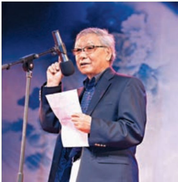
不少人都讀錯鄭愁予的名字。

其實，無論深淺雅俗，名字都是父母的一分心意。張曉風說「名字是天下父母滿懷熱望的刻痕……都是一篇簡短、質樸的祈禱」，所言甚是。