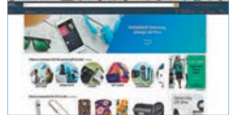
■亞馬遜國際版網頁