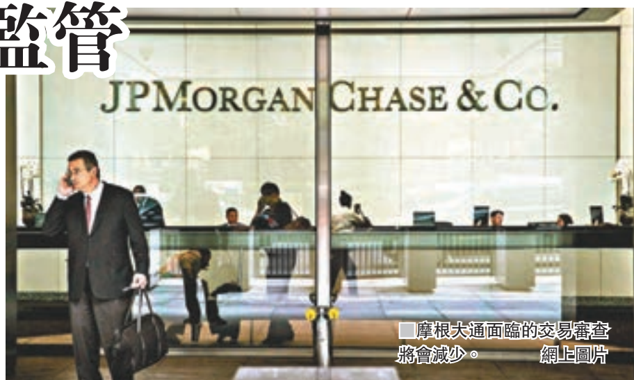
■摩根大通面臨的交易審查將會減少。

簡規管要求，取代過度複雜和欠缺效率的條文。「沃爾克2.0」將進行為期60日的公眾諮詢，除聯儲局外，另有4個監管部門預料將跟隨聯儲局步伐，調整個別監管