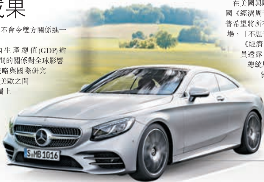
■特朗普稱不想平治汽車再於紐約行駛。網上圖片