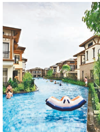
■ 陽台直通泳池，一出「家門」就是歡騰的水上樂園。

據介紹，這裡的2公里長泳道直通每個酒店陽台，陽台之間綠植成為天然的隱私屏障。換好泳衣，便可以直接從房間下水，像人魚一樣暢遊水中。每棟別墅之間有入戶泳道相接，可從自家出發，經泳道游至會所泳池。夏日來此度過周末，可以在這個超級水上樂園回歸孩子的天性。