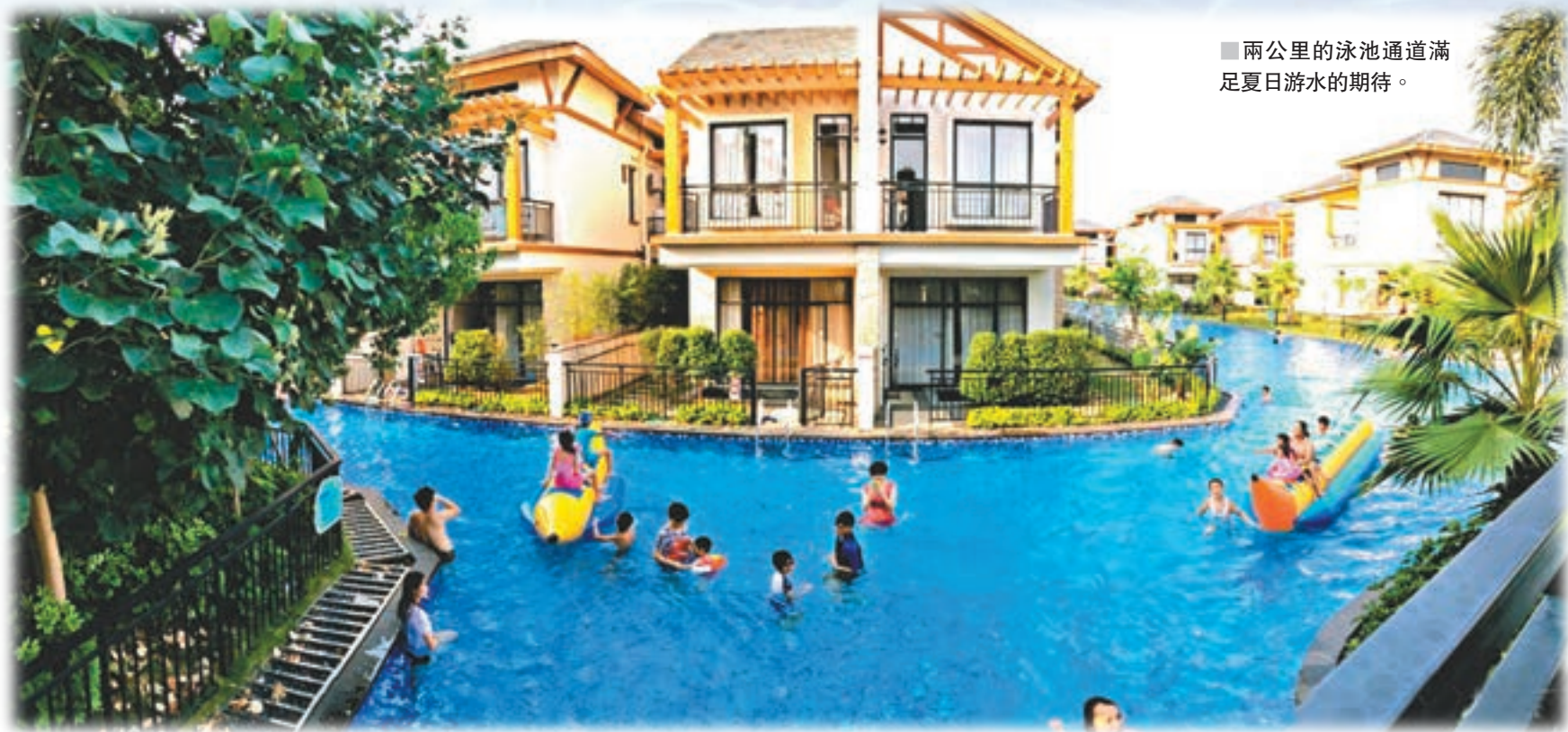
■ 兩公里的泳池通道滿足夏日游水的期待。