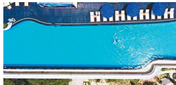
■ 海陵島上的無邊際泳池，可享受海天一色的風光。

通往粵西的鐵路即將開通，這意味着茂名、陽江、湛江等地的海陵島也會隨之興闢。陽江海陵島，外界並不陌生。早年因為打撈南海一號，以及隨後建造的博物館，讓此地聲譽漸隆。但是，許多來此的遊人，對該地的酒店配套卻不時感到遺憾。如今，這個局面可謂「士別三日當刮目相看」。島上的北洛秘境度假酒店，在樓頂之上打造了一個30層高的無邊際泳池。圖片一經流出，便吸引無數遊客垂詢。