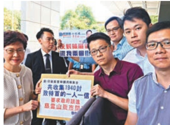
民建聯向林鄭月娥遞交請願信,促政府盡快在慈雲山區覓地興建政府街市。

香港文匯報訊(記者 陳川)慈雲山中心原有兩個街市合共逾160個攤檔,惟領展宣佈回收慈雲山中心二樓街市所有攤檔,以及預計於本年底進行所謂的「資產全面提升工程」。民建聯黃大仙支部就此收集到1,940封信件,並於近日向行政長官林鄭月娥遞交請願信,以表達居民的不滿、憂慮,並要求政府盡快在慈雲山區覓地興建政府街市,及要求領展在原址保留街市用途等。