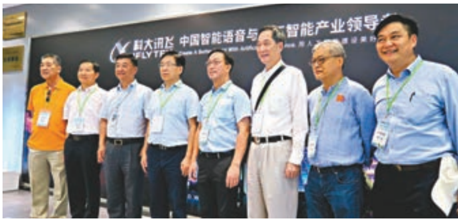
▲鄉議局成員考察一家語音人工智能創科企業。