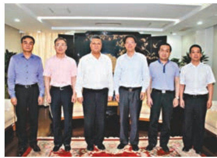
張曉明會見馬興瑞。

陳帥夫表示,國務院港澳事務辦公室已公佈了兩批便利港澳居民在內地發展的政策措施,讓在內地港人在相關領域享有內地居民的同等待遇。特區政府會繼續爭取港人在大灣區就業、創業、營商等方面的便利。