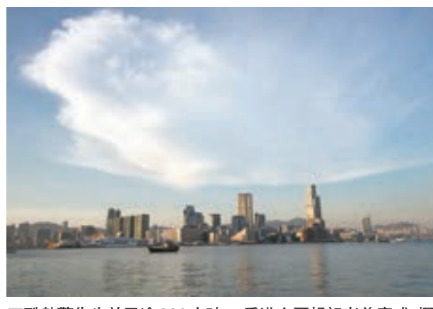
酷熱警告生效已逾300小時。