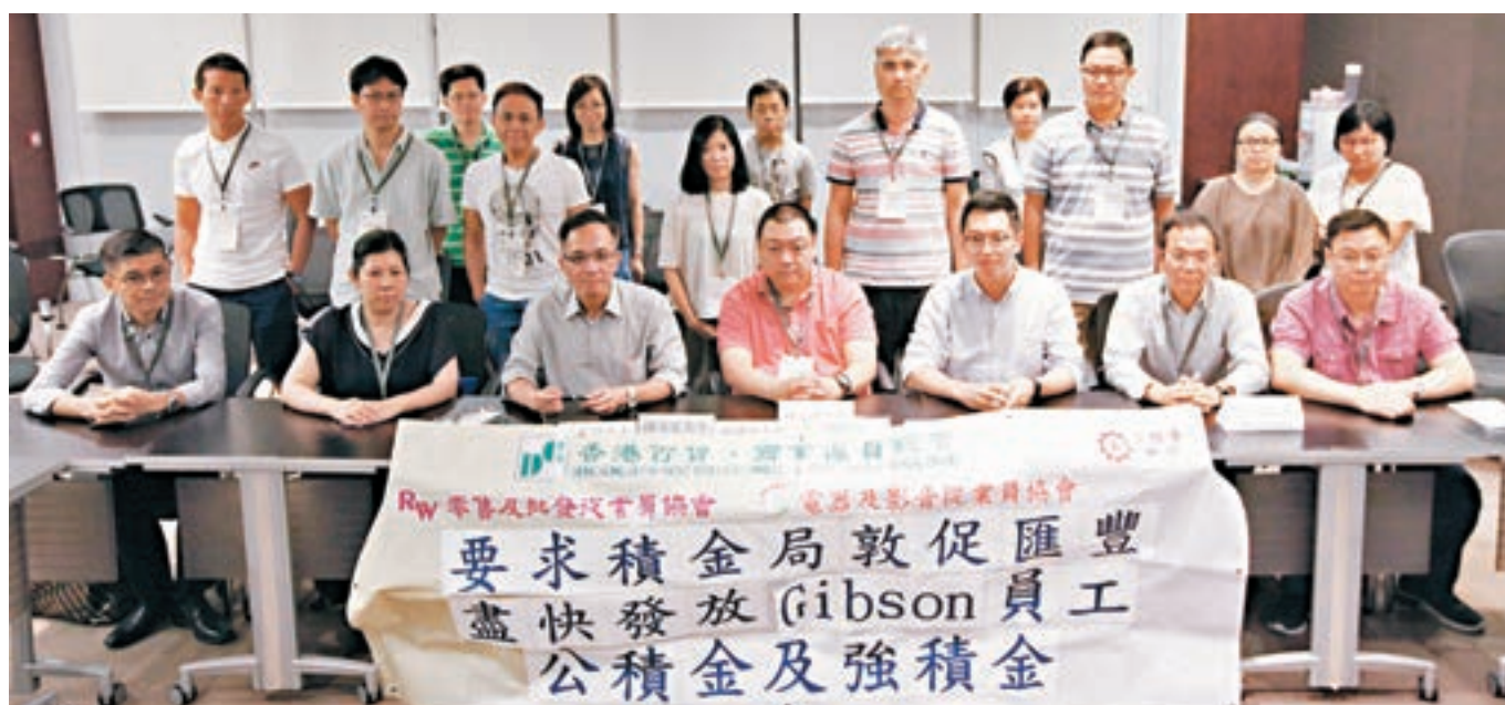
工聯會立法會議員何啟明聯同近80名苦主見積金局代表商討有關公積金發還程序及提出相關建議。

香港文匯報訊(記者 顏晉傑)美國百年結他品牌Gibson上月初申請破產保護令，本港子公司隨之宣告自動清盤，事件揭發政府一直對公積金計劃欠監管。46名於2000年前已入職的Gibson員工投訴，清盤人未有將員工資料交予公積金受託人，令他們不知何時才能取回應有金錢，並批評政府亦未有相關法律予以規管。協助受影響員工的工聯會勞工界立法會議員何啟明期望，負責監管公積金的積金局可協調相關機構，令受影響員工早日取回公積金。