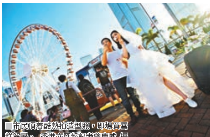
市民頂着酷熱拍造型照，即場買雪糕解暑。

他指出，近日儲水池乾涸，不足應付全村19戶的需求，需要自行購買蒸餾水飲用，晚上要等到11時才儲夠水洗