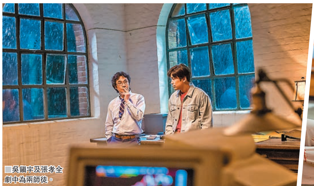
吳鎮宇及張孝全劇中為兩師徒。

也現場演唱了一首最近發表過的新歌《漫漫漫路》。而阿牛陳慶祥也驚喜現身和心潔合唱《裙擺搖搖》、《對面的女孩看過來》，阿牛搞怪走下台賣唱募捐，將現場氣氛炒熱。當張張張艾嘉《愛的代價》響起時更是將現場氛圍在一片熱鬧之後推向高潮，最後全體參與的藝人與張姐一起演繹清新編曲的《童年》，為晚宴完美謝幕，賓客盡興而歸。