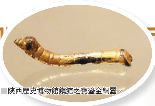
陝西歷史博物館鎮館之寶鎏金銅蠶。

另一件史前先民使用的日常用品尖底瓶也較為罕見。據悉，關於這件尖底瓶的功能也存有爭議。有學者認為它是一種汲水器，其奧妙在於兩耳正好位於器身重心，穿繩後將瓶放入水面，水滿後瓶體會自動豎直，充分體現了史前先民的聰明智慧。另有學者則認為尖底瓶是釀造穀芽酒（今天的醪糟）的器具，考古工作者曾在此類器物中發現釀酒的殘留物，也間接證明了這一點。至於它到底是哪種用途，相信隨着考古的深入，還會有不一樣的發現。