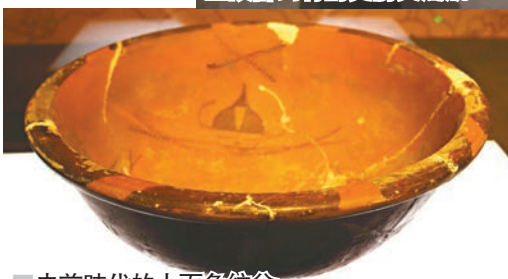
史前時代的人面魚紋盆。