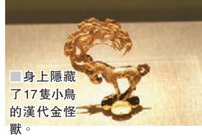
身上隱藏了17隻小鳥的漢代金怪獸。