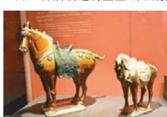
唐三彩「三彩三花馬」。

龍是中華民族的象徵，而唐代是中國封建社會的鼎盛時期。專家告訴記者，由於這一時期國力強盛，唐人塑造的藝術品，無論是動物或人物，都呈現出一種積極進取、自信樂觀的精神風貌。這件神采飛揚的鎏金鐵芯銅龍所擁有的氣勢美，正是一個時代的烙印，也是自信的大唐文化的真實寫照。