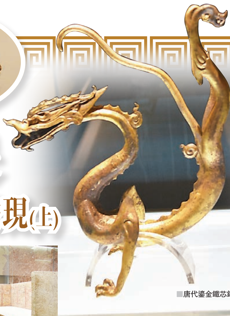
唐代鎏金鐵芯銅龍。