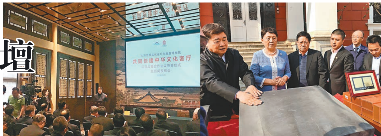
太湖世界文化論壇與故宮博物院共建「中華文化客廳」。

另外，太湖世界文化論壇將編制《中華文化客廳文化名錄》，開展中高端文化創意禮品定製。該項目還將以中醫藥養生觀為核心思想，傳承中國古老的養生文化內涵。同時，項目將開展多種形式的文化傳播項目。如中外主題文化交流活動、創辦《中華文化客廳》雜誌、「中華文化客廳」文