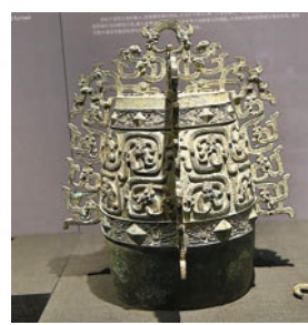
記錄秦人崛起的秦公鎛。