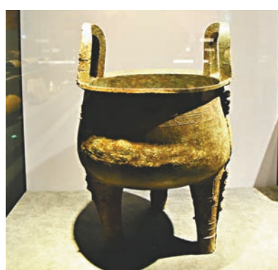
周代青銅器的代表饗餐紋鼎。

可能很多人都聽過「天子九鼎八簋，諸侯七鼎六簋」，也就是西周的列鼎列簋制度。在周代，當鼎和簋從實用器演變為重要的禮器之後，便一起成為「明尊卑、別上下」的標誌。