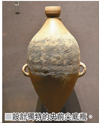
設計獨特的史前尖底瓶。

和饗餐紋鼎不同的是，此次展出的宰獸簋其蓋內有銘文12行。該器物通高37.5厘米，重14.4公斤，形制為西周中晚期方座簋樣式，器身裝飾以雲雷紋、變形獸面紋等。129字的銘文詳細記錄了周王在周原的師錄宮冊命宰獸的事情，宰獸簋也是目前發現記錄西周冊命制度最完整的銘文之一，為研究西周冊命制度增添了重要的實物資料。