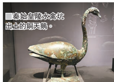
秦始皇陵水禽坑出土的銅天鵝。