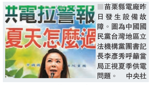
苗栗縣電廠昨日發生設備故障，造成中國國民黨台灣地區立法機構黨團書記長李彥秀呼籲當局正視夏季供電問題。中央社

香港文匯報訊 綜合台媒報道，台灣苗栗縣通霄電廠昨日設備跳脫，造成周邊約7萬多戶停電，其中約3.2萬戶已由其他電廠轉供復電，剩下近3.8萬戶仍在搶修中。