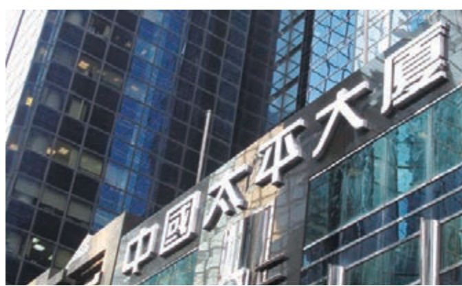
中國太平日前推出服務三地車主的「港珠澳大橋跨境車輛保險方案」

舉世矚目的港珠澳大橋預計將於2018年下半年正式通車。作為唯一一家在三地均開展車險業務的綜合金融保險集團，中國太平保險集團旗下太平香港、太平澳門、太平財險充分發揮境內外優勢，積極服務大灣區建設，為港珠澳大橋跨境車輛提供系統的風險保障服務，推出服務三地車主的「港珠澳大橋跨境車輛保險方案」。